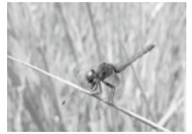
▲ハッチョウトンボ(オス)

日本で最小といわれるハッチョウトンボの大きさは、1円玉（直径20ミリ）の中に納まる程度です。気温が上昇する5月上旬から羽化が始まり、9月中旬まで見ることができます。羽化の瞬間は白くうっすらと色が透き通って見える程度ですが、数分後には色が変わり、オス・メスの判別がつくようになります。オスは羽化後15～20日程でトウガラシのように胴体が赤く変化します。静止状態であることが多いハッチョウトンボですが、天候の良い日にはオスが縄張り争いをする活発な様子を見ることができます。