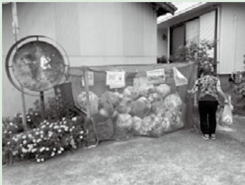
利用者宅を訪問し、ゴミステーションまでのごみ出し