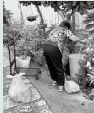
ごみを入れているポリバケツの掃除