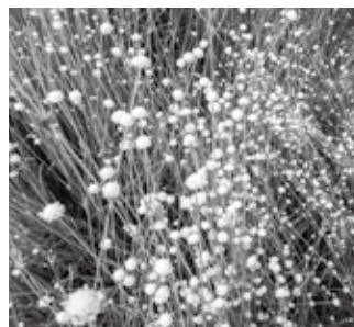
シラタマホシクサ