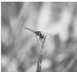
ハッチョウトンボ