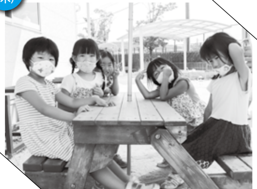
▲ 手作りのベンチに座る園児たち

あなたは写っていませんか。もし写っていれば、写真をおわけしますのでご連絡ください。政策協働課調査広報係 ☎(48)1111(内線1310)