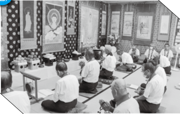
▲ 百万遍念仏を唱える皆さん