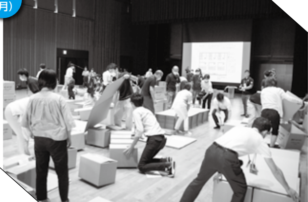
▲ 段ボールベッドなどを組み立てる参加者