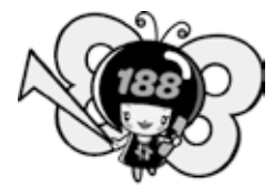
消費者庁 消費者ホットライン188イメージキャラクター「イヤヤン」

一人で悩まず、まずは相談 大切なのは、すぐに相談することです。困ったときは、一人で抱え込まないで「消費者ホットライン『いやや!』(局番なしの188)」まで電話してください。 「泣き寝入りは超いやや(188)！」で覚えてね