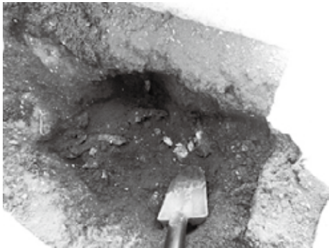
▲ 掘り返してみました。かなり小さくなっています。