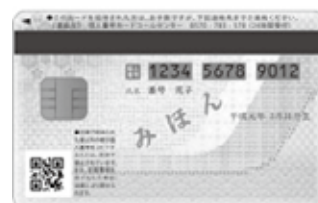
個人番号カード(裏)