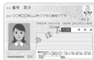
個人番号カード(表)