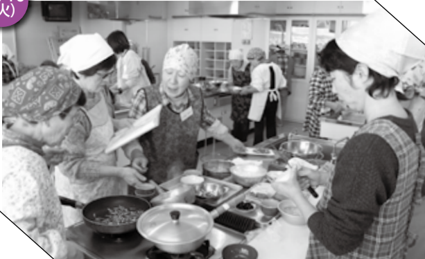
▲ 丹精込めて作るおせち