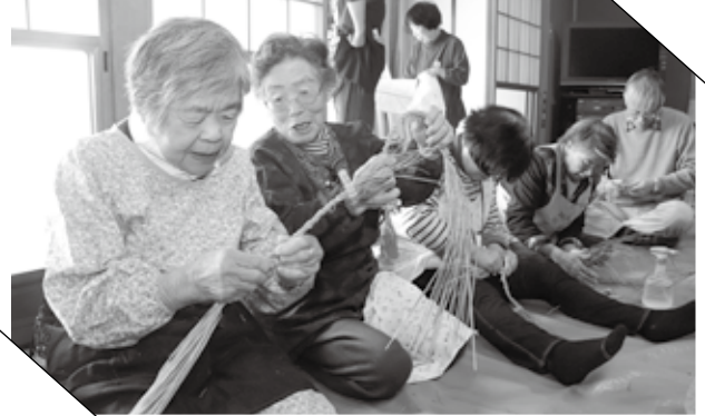
▲ 参加者同士教え合って作る(右・左)