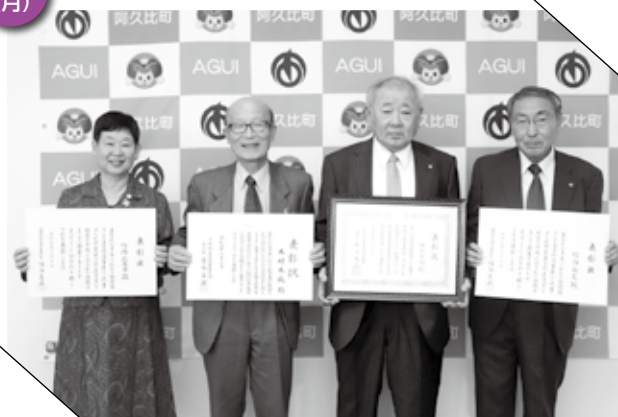
▲ 笑顔を見せる保護司の皆さん