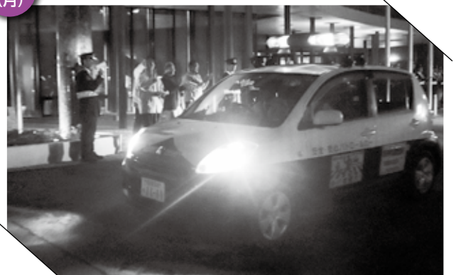
▲ まちの安全安心を守ります