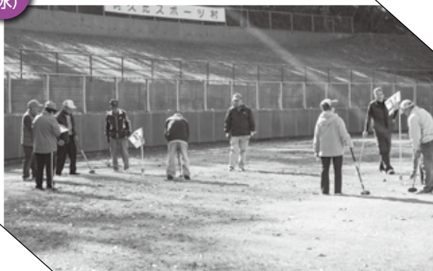
▲ グラウンドゴルフを楽しむ皆さん