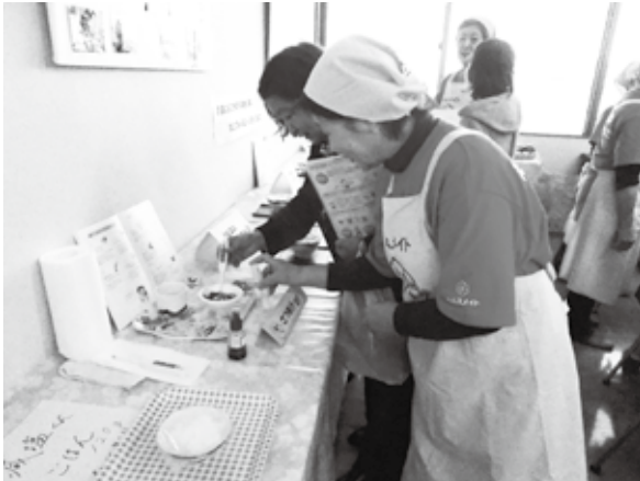
▲ 減塩の話をする食生活改善推進員と来場者

11月10日に町保健センターで「第32回阿久比町健康まつり」が開催されました。町食生活改善推進員の栄養コーナーが設けられ、食生活改善推進員の日頃の活動や元気な体づくりのために1日に必要な野菜の量などが紹介されました。また、牛乳で作ったわらび餅と麩で作ったラスクの試食や減塩されたさつま汁の試食がありました。来場者は、健康な体づくりにつながる知識を学び、手作りのおいしさを再確認しました。