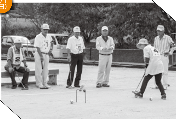
▲ 和やかにプレーする皆さん