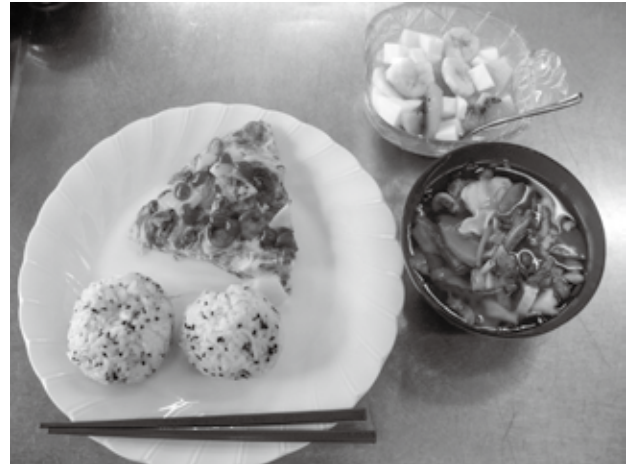
▲ 出来上がった料理