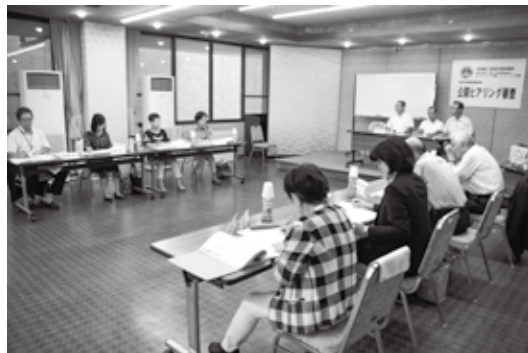
ヒアリング審査の様子