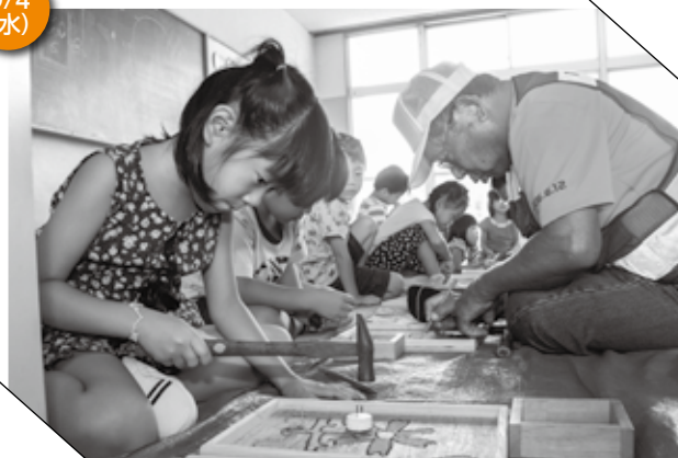
▲ 慎重にくぎを打つ園児たち