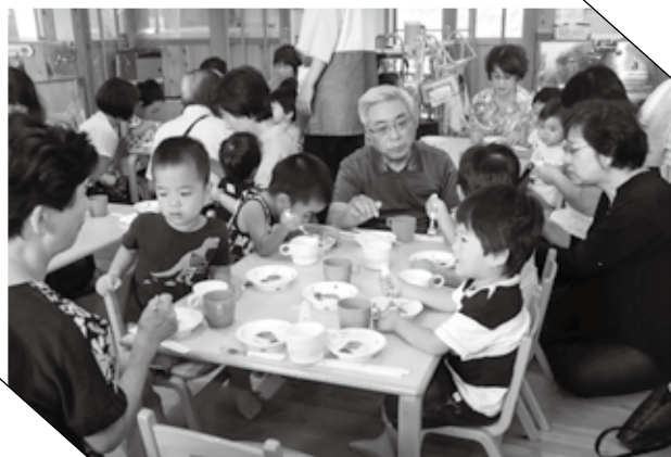
▲ おじいちゃん、おばあちゃんと食べるおやつ