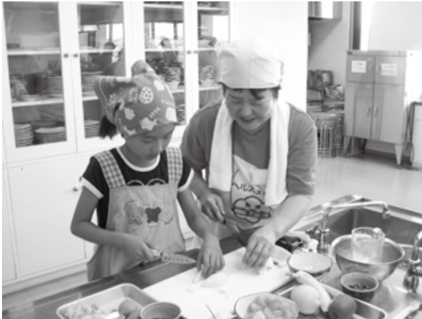
▲ 野菜を切る参加者と町食生活改善推進員

この日の献立は、「すいとん」「かんたんスパニッシュオムレツ」「じゃこチーズのおにぎり」「牛乳かんのフルーツソース」。子どもたちは、町食生活改善推進員や保護者に教えてもらいながら、野菜を切ったり、炒めたりして、一緒に楽しく料理し、自分たちで作った料理をおいしそうに食べていました。