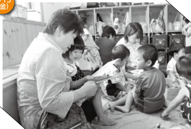
▲ 絵本を読んでもらう園児