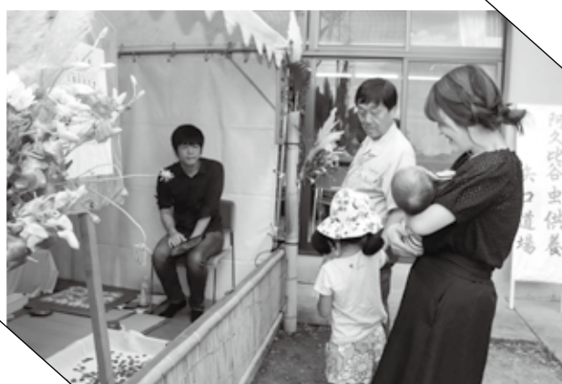
▲ 各小屋でお参りする家族

県の無形民俗文化財に登録されている、農業で犠牲になった虫を供養する「阿久比谷虫供養」が矢口地区の矢口公民館で行われました。供養場には大道場と8つの小屋が設けられ、町指定文化財の掛け軸や供え物が飾られました。大道場では導師の先導による百万遍念仏の唱和が行われ、地区の農家の方など多くの方が参加しました。今年も伝統ある虫供養は地区の方の努力により盛大に行われ、次の担当地区である阿久比地区へ無事に引き継がれました。