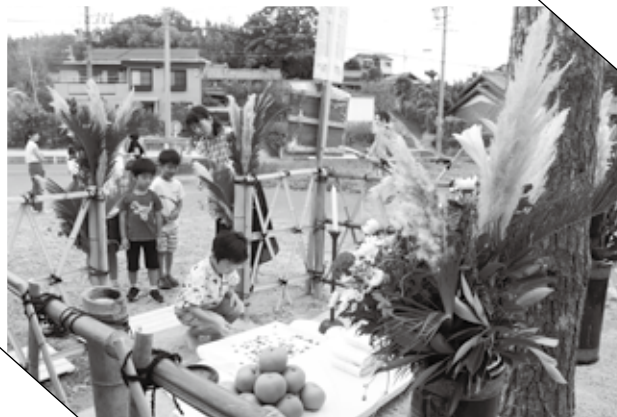
▲ 砂踏みする子ども