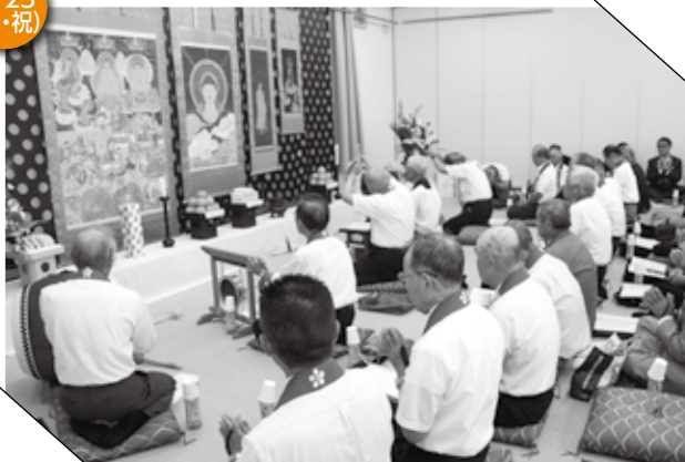
▲ 百万遍念仏の唱和