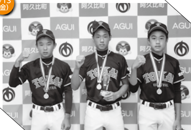
▲ ガッツポーズを決める3人