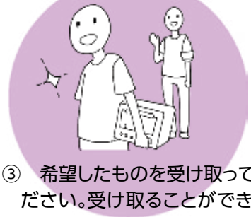
③ 希望したものを受け取ってください。受け取ることができるのは一世帯当たり2点までです。

※ 収集場所では監視員の指示に従ってください。 ※ 自転車は防犯登録がされているため、再利用できません。