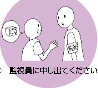
① 監視員に申し出てください。