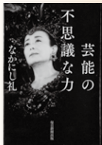
『芸能の不思議な力』 なかにし 礼 著 (毎日新聞出版)