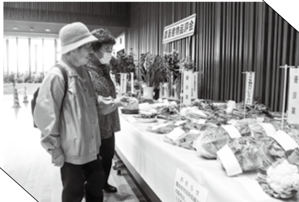
▲ 立派に育った農畜産物を眺める

第41回阿久比町産業まつりが役場駐車場を中心に開催され、2日間で約6,000人が訪れました。会場には協賛企業や商店などの出店が立ち並び、来場者は焼きそばやうどん、「アグピー人形焼き」などをおいしそうに頬張っていました。アグピアホールのステージでは少林寺拳法の演舞や和太鼓の演奏などが披露され、来場者の注目を集めていました。