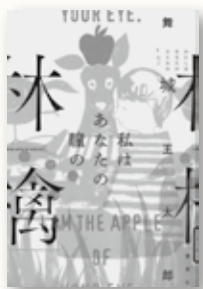
『私はあなたの瞳の林檎』 舞城 王太郎 著 (講談社)