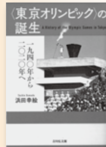
『<東京オリンピック>の誕生』1940年から2020年へ 浜田 幸絵 著 (吉川弘文館)