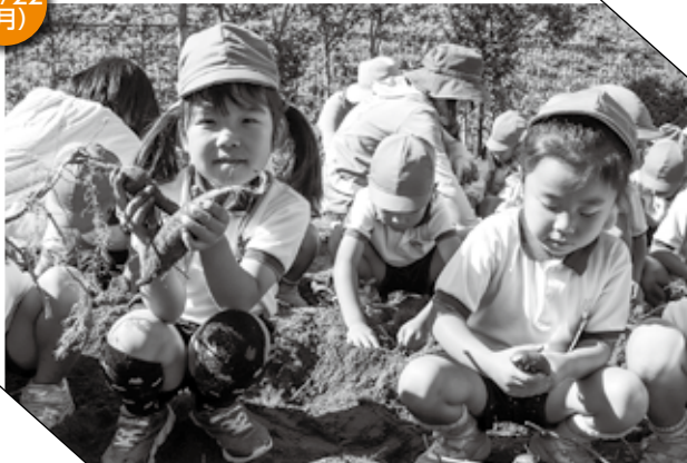
▲ いっぱいサツマイモを掘るぞ