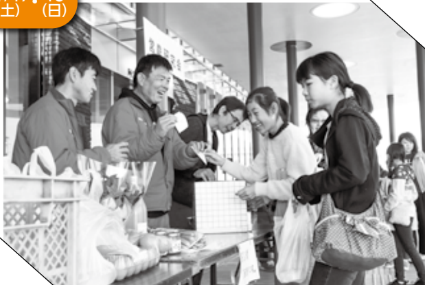
▲ 農畜産物が当たって喜ぶ参加者