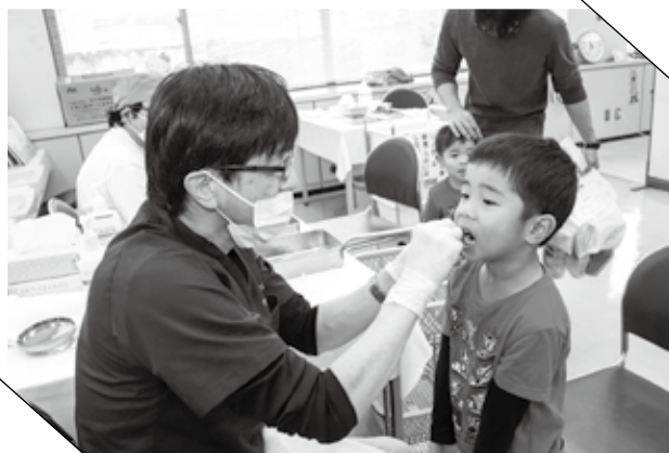
▲ フッ素塗布をして強い歯に

町民の健康増進を目的として、町保健センターで第31回阿久比町健康まつりが開催され、約600人が来場しました。会場には足腰の負担のかかり具合を測定する「歩行測定」や声をパソコンで分析し、健康状態や性格を診断する「ボイスクリニック」などさまざまなコーナーが設けられ、来場者は「健康を意識するきっかけになりました」と話しました。