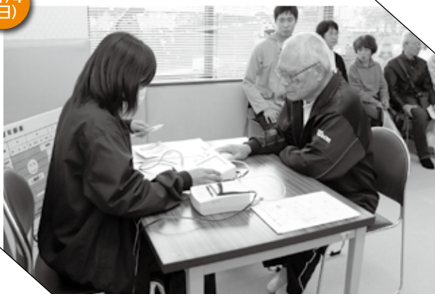
▲ 血管年齢測定を受ける参加者