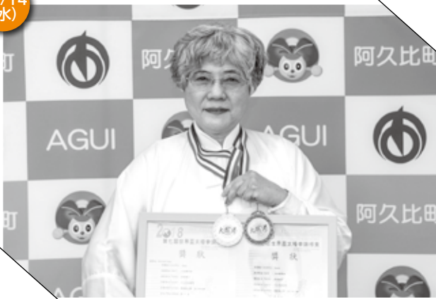
▲ 胸に輝く金メダルと銅メダル