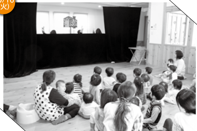
▲ 人形劇に夢中になる園児たち