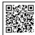
▲し尿くみ取り券取扱所一覧

年末は12月28日(金)まで、年始は平成31年1月7日(月)から平常日程でくみ取りをします。申し込みは、町指定の「し尿くみ取り券取扱所」で早めをお願いします。