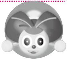
町マスコットキャラクター アグピー

ホタルは5月下旬に水から上陸し、土の中でサナギになります。サナギになったホタルは、6月中旬から7月上旬に羽化します。羽化したホタルは、草の中で、休憩や求愛活動を行います。この時期は土手の草刈りを行うと思いますが、できる限り刈った草を燃やさないようご協力をお願いします。