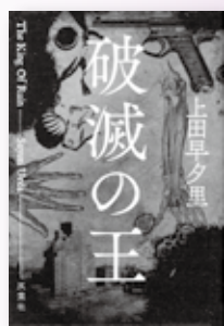
『破滅の王』 上田 早夕里 著 (双葉社/2017年)