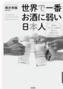
『世界で一番お酒に弱い日本人』 自分のアルコール体質を知って、お酒とうまく付き合うために！ 横井 秀輔 著 (文芸社/2017年)