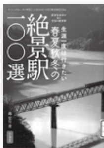
『生涯一度は行きたい 春夏秋冬の絶景駅100選』 越 信行 著 (山と溪谷社/2017年)

『世界の美しいステンドグラス』 パイ インターナショナル 編著(パイ インターナショナル/2017年)