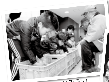
みかんのつかみ取り