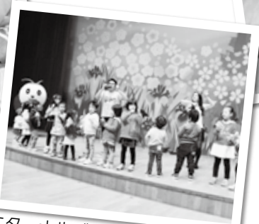
エターナルジャーニーのステージ