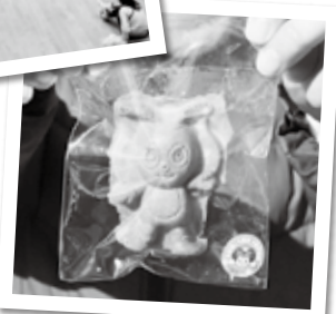
新名菓“アグピー人形焼き”