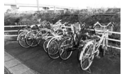
駐輪場所を占領する放置自転車

また、自転車の乗り捨てや置き自転車は絶対にしないようお願いします。一人一人が心掛け、きれいな駐輪場にしましょう。