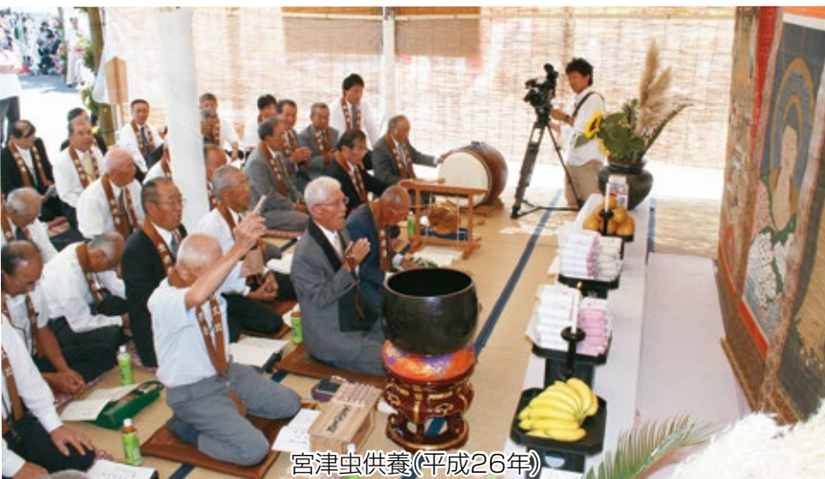
宮津虫供養(平成26年)