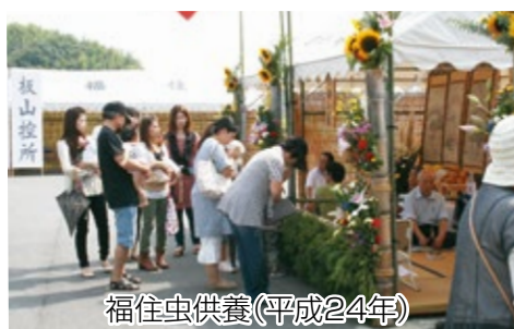
福住虫供養(平成24年)