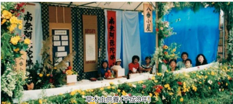
草木虫供養(平成9年)