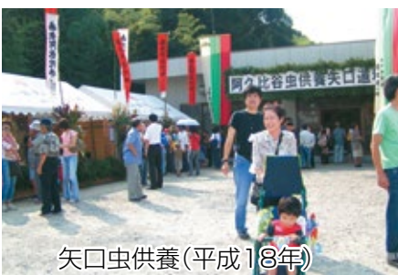
矢口虫供養(平成18年)