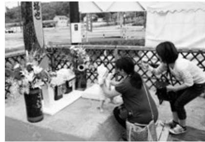
〈砂山を踏む子ども〉