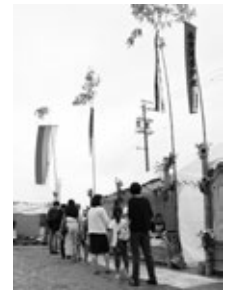
〈昨年の会場の様子〉