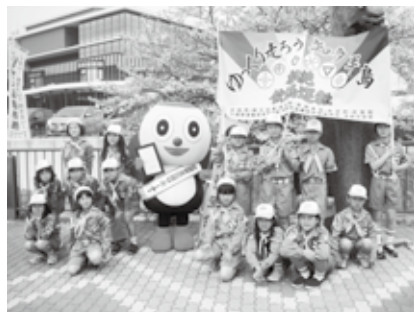
宮津団地交通少年団の子どもたちとアグピー