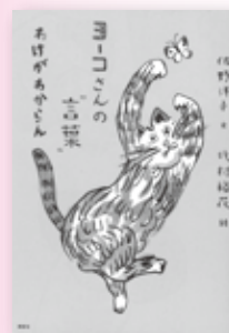
『ヨーコさんの“言葉” わけがわからん』 佐野 洋子 文 (講談社/2017年)