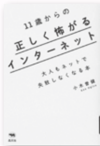
『11歳からの正しく怖がるインターネット』 小木曾 健 著 (晶文社/2017年)