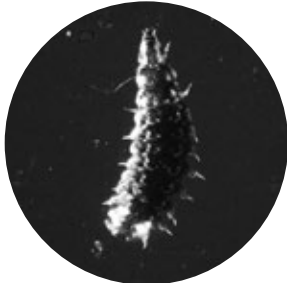
発光するホタルの幼虫