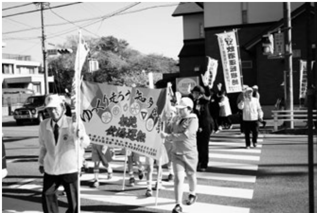
昨年末の飲酒運転根絶パレードの様子

暖かい陽気となり、外出する機会も増えることから、子どもや高齢者が犠牲となる交通事故の発生が心配されます。春の全国交通安全運動として、次の運動重点に沿った運動を県民総ぐるみで展開し、交通事故の防止を図ります。