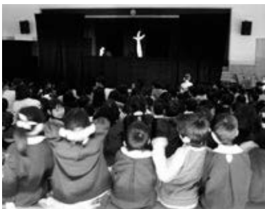
読書指導グループ「ぶんぶん」の出張公演(英比保育園)

子どもが本に親しみ、読書の大切さや楽しみを感じられるよう、幼稚園や保育園では保護者やボランティアの協力を得ながら読み聞かせを行っています。