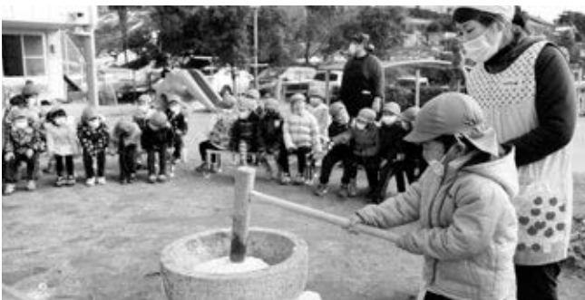
〈元気にお餅をつく園児（ほくぶ幼稚園）〉