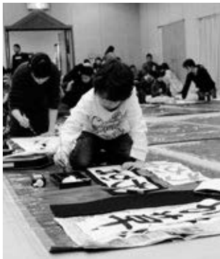
〈墨を筆に含ませる子ども〉