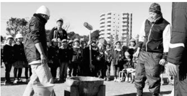
〈力いっぱいお餅をつく園児（英比保育園）〉