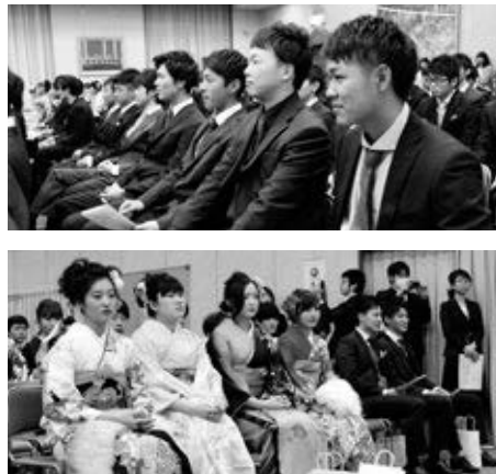
〈式典に臨む新成人たち〉