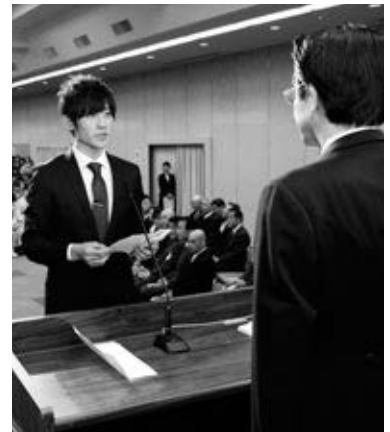
〈これからの活躍を誓う〉

町の成人式が1月8日、エスペランス丸山で行われ、218人の新成人が参加しました。会場には早くから、鮮やかな振り袖や真新しいスーツを身にまとった新成人が続々と集合。久しぶりに顔を合わせた友人などと再会を喜び、思い出話に花を咲かせたり、記念写真を撮ったりしていました。