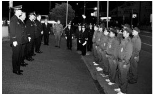
激励を受ける消防団員たち