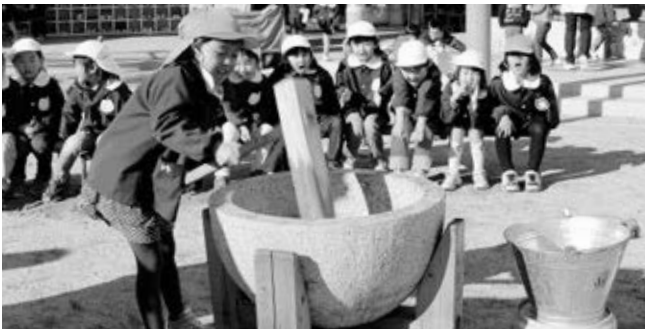
〈声援を受けてお餅をつく園児（草木保育園）〉

年末・年始の恒例行事「お餅つき」が、町内の幼稚園や保育園、小学校で行われ、子どもたちが楽しくお餅をつきました。できたての柔らかいお餅にあんこやきなこ、しょう油などを付け、おいしそうに食べる子どもたち。「やっぱり、つきたては最高」と笑顔でいっぱいでした。