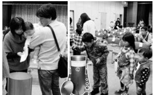
思い出の品を詰める参加者

年の瀬の12月27日～29日の3日間、町消防団が防火・防犯のため年末夜警を行いました。消防団員らはそれぞれの詰め所で待機をしたり、赤色回転灯搭載の消防自動車でも地区を巡回したりして、夜間の警戒に当たりました。期間中の28日には、町長などが各分団の詰め所を訪れ、町民のために活動する団員らを激励しました。