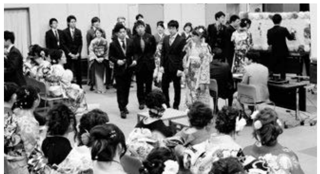
〈みんなで楽しんだ“新成人の集い”〉

式典で、町長をはじめ多くの来賓から激励の言葉を送られた新成人たち。人生の節目を迎え、真剣な面持ちで式に臨んでいました。次に行われた新成人の集いでは緊張もほぐれ、実行委員会が用意した思い出のスライドや、大抽選会などで大いに盛り上がっていました。