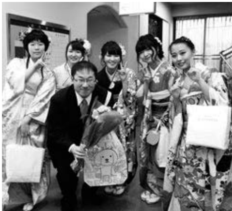
〈恩師との記念撮影〉