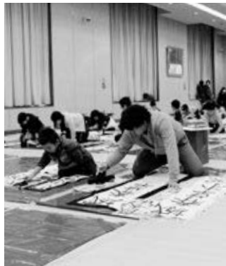
〈仲良く書き初めに挑む親子〉