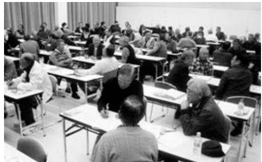
防犯について意見を交わす参加者たち

町のわくわくコラボ事業「タイムカプセルでつなぐ～未来へのメッセージ～」が12月4日、町商工会青年部主催で行われました。約100人の参加者たちは、10年後の自分や家族に思いをこめて、写真や手紙、DVDなどをタイムカプセルに詰めました。参加者は「10年後は子どもが成人。きっと良い記念になります」と笑顔で話しました。