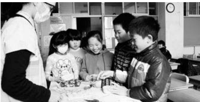
〈お餅をおかわりする児童たち（英比小学校の土曜教室）〉