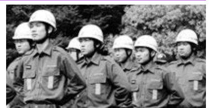
若い力が必要です

現在、現役の消防団員が新入団員確保のため、ご家庭を訪問し、直接勧誘活動を実施しています。皆様のご理解とご協力をよろしくお願いいたします。