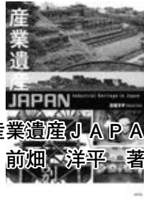
『産業遺産 JAPAN』 前畑 洋平 著