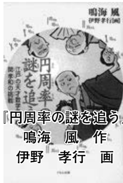
『円周率の謎を追う』 鳴海 風 作 伊野 孝行 画