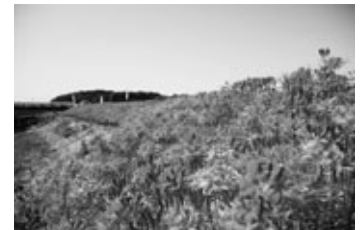
権現山と阿久比の彼岸花