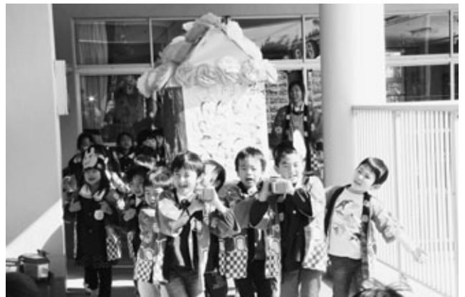
〈盛り上がるおまつりごっこのフィナーレ〉

草木保育園で2月10日に“おまつりごっこ”があり、年長児が出店を開いたりおみこしを担いで練り歩いたりしました。年長児はお客の0歳児から年中児までの園児たちが楽しめるおまつりにしようと、1月初旬から話し合いや商品作りなどの準備を進めてきました。たこ焼き、焼き鳥など11種類の出店では、お客の園児たちが、本物そっくりで作られた商品に目を輝かせ、楽しく買い物をしました。最後には、おみこしを担ぐ年長児と他の年齢の園児たちが一緒になって「わっしょい、わっしょい」と元気のいい掛け声を響かせ、おまつりごっこを締めくくりました。