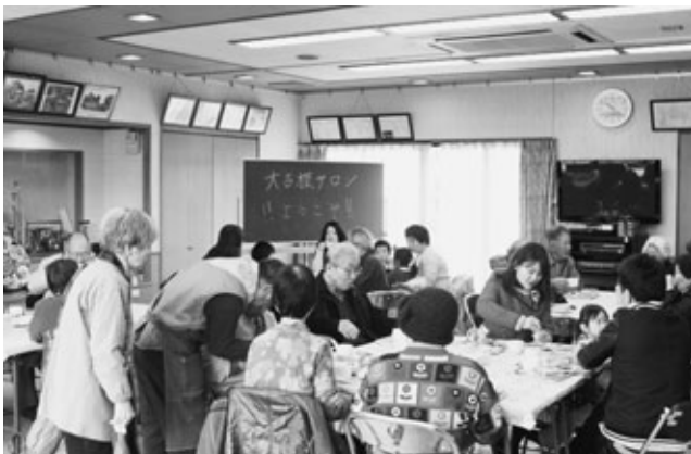
〈会話を楽しむ参加者たち〉

地域交流の場「行こうよ！大古根サロン」が11月28日から、大古根公民館で始まっています。ボランティアグループ大古根ふれあい会といきいきクラブの和楽会が中心になり、高齢者や家族連れなどが、モーニングコーヒーなどを飲みながら会話をし、地域でのつながりを深めてもらおうと立ち上げました。その2回目となるサロンが1月28日に行われ、1回目を上回る100の方が訪れました。参加した方は「年齢に関係なく参加でき、地域に住むいろいろな方と話せておもしろかったです」と話していました。