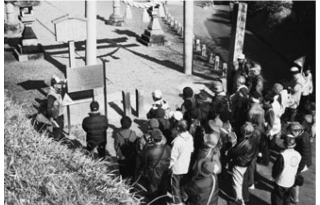
〈ガイドの説明を聞く参加者たち〉

「あぐいふるさとガイド」が行う第5回目の「公開ガイド」が、暖かい日差しが降り注ぐ1月27日に行われました。この「公開ガイド」は、町内にある有名なものから隠れたものまで、さまざまな名所をふるさとガイドの皆さんの解説を聞きながら、ゆっくり歩いて満喫できる人気の催しです。今回は「峠の地蔵尊とホタルの里をひと巡り」というテーマで行われ、39人の参加者たちは、白沢地区にある北原天満宮、峠の地蔵尊、保安寺などの名所を巡りました。保安寺ではめったに見ることのできない円空仏が特別公開され、参加者たちは、興味深そうに見入っていました。