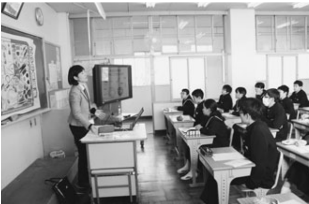
〈朝食の大切さを考える授業の様子〉

阿久比中学校で1月28日、「食に関する指導」がありました。給食センターの学校栄養職員が1年1組の生徒35人に、「自分の朝食を見直そう」をテーマにした授業を行いました。生徒たちは「朝食をきちんと食べる人は、学力・体力テストの成績が良い傾向にある」など、さまざまなデータを基にした話を聞き、朝食を食べることの大切さを学びました。自身の朝食から足りない栄養素を考え、付け加える方法も学びました。授業を受けた生徒は「朝食を食べると授業に集中できることが分かった。これからは毎日朝食を食べるようにしたい」と話しました。