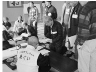
災害ボランティアセンター運営訓練の様子