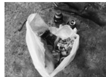
混入していた空き缶

今回混入のあった空き缶は、金属資源として、金属部品や新たな缶を作る材料としてリサイクルができるものです。中身を取り除き、軽くすすいでから「資源ごみの日」に出してください。少し手間をかけることで、ごみの削減や限りある資源の有効利用につながります。ごみはしっかり分別して、ごみの減量に努めましょう。