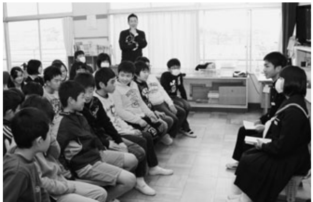
〈先輩からの話を聞く児童たち〉

幼保小中一貫教育プロジェクトの一環で、小学校6年生が抱く中学校生活への不安を少しでも解消しようと、町内の4小学校で「先輩の話を聞く会」がありました。英比小学校では2月9日、卒業を控えた中学校3年生が母校を訪れ、生活や勉強、部活について自身の経験を交えながら話しました。小学生の「おすすめの部活は何ですか」「難しい教科は何ですか」といった素朴な疑問にも、先輩としてしっかり答えました。話を聞いた児童たちは「今日の話聞いて中学校が少し楽しみになってきた」と話し、中学校への良いイメージを膨らませる有意義な時間になりました。