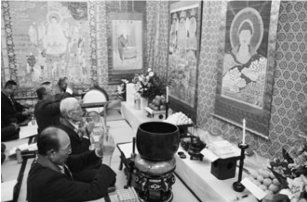
〈念仏を唱える同行衆〉

「阿久比谷虫供養」の一連行事「寒干し」が1月31日、今年の当番に当たる横松地区の公民館で行われました。冬の冷たい風にさらしてカビや虫の害を防ぐために、保管箱から出された町指定文化財の12幅の掛け軸や虫供養の道具一式が、会場内に飾りつけられました。掛け軸の前には9月22日に行われる本番さながらに花が飾られ、果物なども供えられました。地区の皆さんが見守る中、先導する導師と同行衆による百万遍念仏の大唱和が、公民館内に響きました。なお、「阿久比谷虫供養」は「知多の虫供養行事」として、愛知県無形民俗文化財に指定されています。