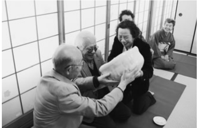
〈両脇の人に支えられ、抹茶を飲む参加者たち〉

直径約35センチメートルの大きな茶わんで抹茶を回し飲む「大福茶会」が、1月31日に福住老人憩の家がありました。今回で29回目を迎えるこの催しは、西大寺（奈良市）の伝統行事「大茶盛り」を参考に、阿久比風土記の会が毎年この時期に開いています。18人の参加者たちは、顔を覆う巨大な茶わんを両隣に支えてもらいながら、健康や幸せを願い、まったりと甘みのある「濃茶」を味わっていました。初めて参加した方は「念願だった大福茶会に参加できてうれしいです。たくさん濃茶をいただけたので、今年は良い年になりそうです」と笑顔をみせました。