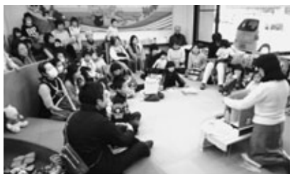
昨年の「親子講座」の様子