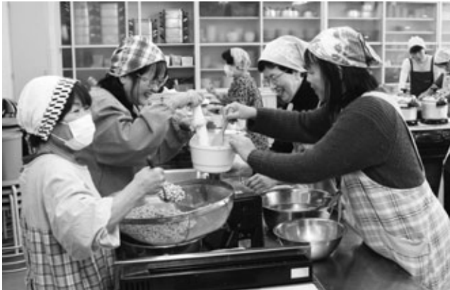
〈大豆をミンチ機でつぶす参加者たち〉

阿久比産の大豆を使った「手作りみそ講習会」が2月5日、中央公民館調理室で開かれました。講習会は「地産地消」を広めるために、あぐいぐらしの会と愛知県農村生活アドバイザーが講師を務め、毎年この時期に行われています。