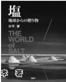
『塩』 片平 孝 著

我々が生きていく上で欠かせないもののひとつ、塩。それは人類に与えられた地球からの贈り物である。