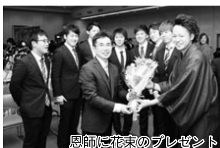
恩師に花束のプレゼント