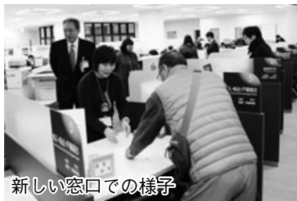
新しい窓口での様子