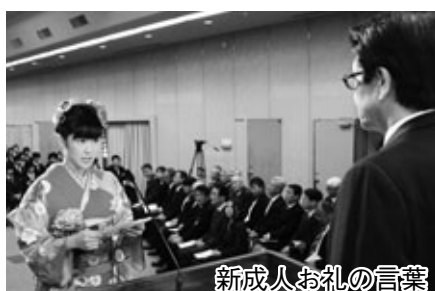
新成人お礼の言葉