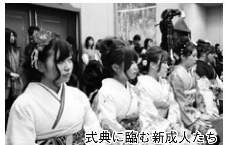
式典に臨む新成人たち

式典終了後には、実行委員会による「新成人の集い」を開催。小中学校時代の思い出の写真のスライドショーや恩師からのメッセージ映像、豪華賞品の当たる大抽選会で大いに盛り上がりしました。