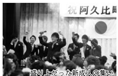
盛り上がった新成人の集い