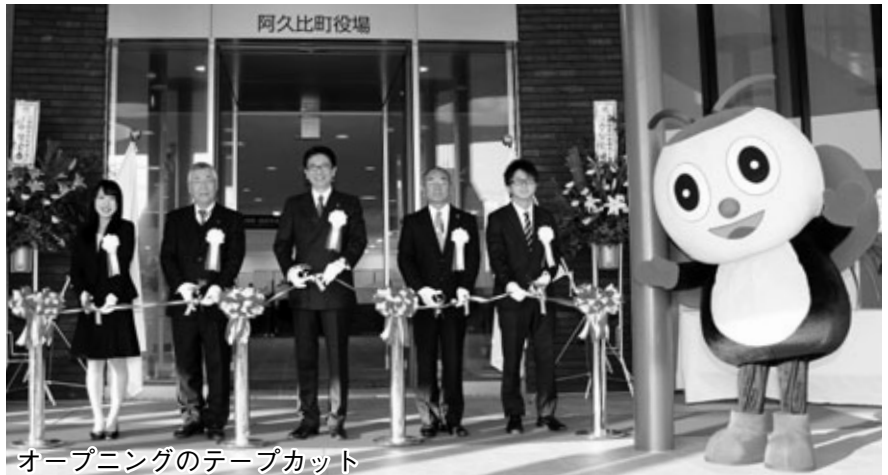
オープニングのテープカット

テープカットの後、オープンした新庁舎には、窓口を利用したり庁舎を見学したりする方が多く訪れました。最初に窓口を利用された方は「昔の庁舎と違い、仕事の内容が大きく表示しており、どの窓口に行けばよいか分かりやすいし、窓口もゆったりしている。町民にとって大変使いやすくなった」と話しました。当日は、町内で活動する音楽団体の協力で琴の演奏が行われ、新庁舎のオープンに華を添えました。