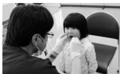
フッ素で虫歯を防ぎましょう