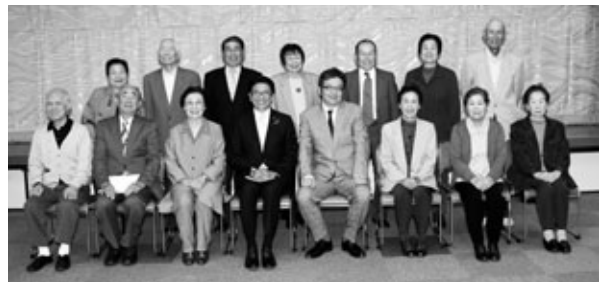
8020運動表彰を受けた皆さん