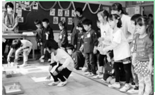
1年生と年長児 ゲームコーナーで交流する

第64回阿久比町文化祭の総合展示会が11月7日と8日の2日間、中央公民館で行われ、朝から多くの来場者が会場を訪れました。総合展示には、公民館を中心に活動している町民らの絵画や書道、俳句、生け花、写真、盆栽などの約800点の作品が展示され、来場者は各作品の前で足を止めて見入っていました。「子どもの作品が思ったより上手でした」「万華鏡が楽しかった」と話す来場者らは、“芸術の秋”のひとときを楽しみました。10月31日と11月1日には勤労福祉センター（エスペランス丸山）で芸能大会もあり、舞台では熱演が繰り広げられました。