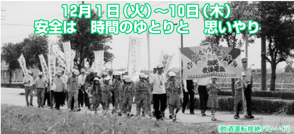
(飲酒運転根絶パレード)

年末は師走特有の慌ただしさから、運転者や歩行者などの注意力が散漫となり、交通事故が起きやすくなります。また、忘年会など飲酒の機会が増え、飲酒運転による事故が心配されます。