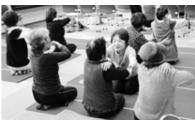
生命（いのち）の貯蓄体操でスッキリ