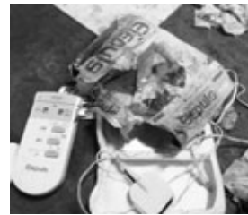
(電気マッサージ機の混入) ▽電気マッサージ機→不燃ゴミ

ごみを捨てる時は、「ごみ収集の手引き」や「ごみ収集カレンダー」をよく確認し、正しく分別してください。