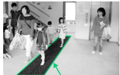
今年からできた“健康への道”