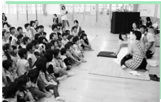
興味をもって「お産劇」を見る園児たち

町内にある全ての幼稚園と保育園の年長児が、入学する小学校の1年生と交流する「町一斉幼保小交流会」が、10月30日にありました。東部小学校では「あきがいっぱい」と題した会を開催し、どんぐりなど秋の自然物を使ったゲームコーナーなどで年長児と交流しました。1年生の優しい姿や楽しい学校の雰囲気に、年長児は「楽しかった。また来たい」と笑顔を見せました。