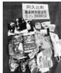
(紙箱・空き缶の混入)