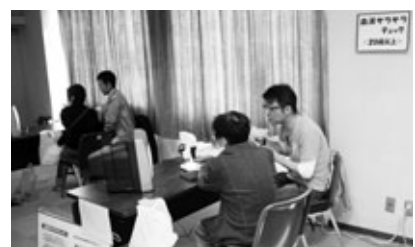
「体チェックコーナー」の様子