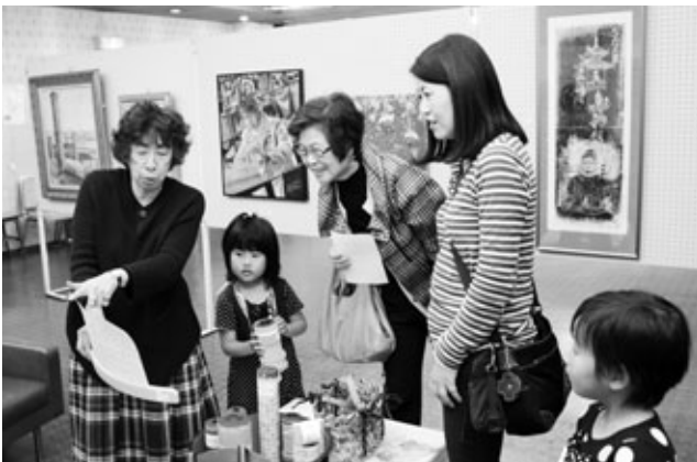
〈作品を楽しむ来場者〉

第64回阿久比町文化祭の総合展示会が11月7日と8日の2日間、中央公民館で行われ、朝から多くの来場者が会場を訪れました。総合展示には、公民館を中心に活動している町民らの絵画や書道、俳句、生け花、写真、盆栽などの約800点の作品が展示され、来場者は各作品の前で足を止めて見入っていました。「子どもの作品が思ったより上手でした」「万華鏡が楽しかった」と話す来場者らは、“芸術の秋”のひとときを楽しみました。10月31日と11月1日には勤労福祉センター（エスペランス丸山）で芸能大会もあり、舞台では熱演が繰り広げられました。