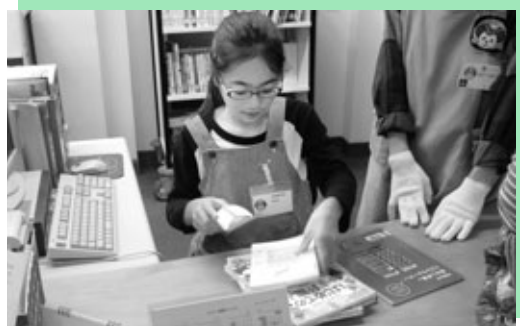
本の受け付けをする子ども

英比保育園で10月26日に、園児らに命や体の大切さを学んでもらおうと助産師らによるグループ「ナールプラ座」の皆さんを招き、年長児とその保護者を対象に「命の大切さを伝えたい～保育園児への性教育」と題した研修会を行いました。子宮内体験や劇などを通して、園児は自分がどうやって生まれてきたかを、保護者は家庭での命や性の伝え方をそれぞれ学びました。