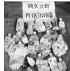
(ペットボトルの混入)