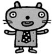
愛知県弁護士会キャラクター 聞之助(きくのすけ)