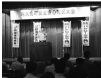
警察署員による講話