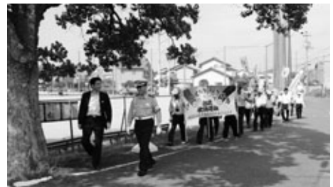
飲酒運転根絶パレード