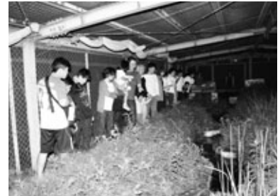
観察室を飛び交うホタルを楽しむ