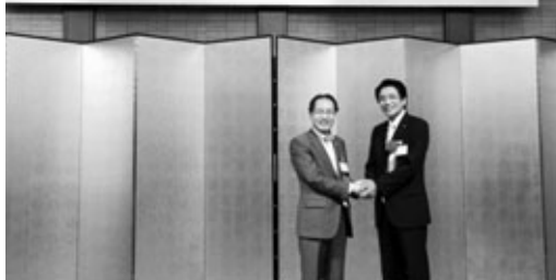
石田倉吉市長（左）と握手を交わす町長（右）

室町時代に伯耆の国（鳥取県）から阿久比町に伝わったとされる花かつみが、鳥取県の倉吉市に里帰りして5周年を迎えました。その記念に町長が、東海鳥取県人会創立50周年記念総会に招かれました。総会では、石田倉吉市長、平井鳥取県知事などと花かつみを話題に親交を深めました。里帰りした花かつみは倉吉市の山名寺の境内に植えられ、毎年美しい花を咲かせています。