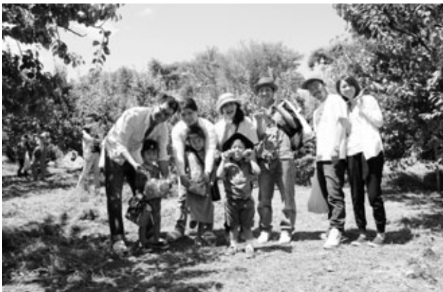
〈青梅もぎとり体験に参加した皆さん〉

梅の特産化を目指したPRと消費拡大を目的とした、阿久比梅栽培組合主催「梅まつり」が5月31日、ふれあいの森と周辺梅畑で行われました。