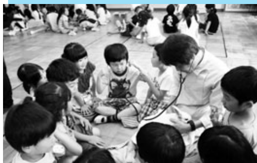
ウサギの心音を聴く子どもたち

阿久比中学校で6月12日、町内の保護司による非行防止講話が行われました。講話は1年生を対象に行われ、各クラスで実施しました。各保護司が自身の経験を踏まえ、非行のむなしさや目標を持つことの大切さを語りかけました。講話を聞いた生徒は「保護司の活動や刑務所のことなどが分かった。悪いことに巻き込まれないようにしっかり生活をしていきたい」と話しました。