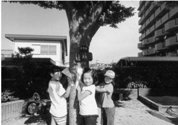
〈ゲームに参加する子どもたち〉

メイツ巽ヶ丘自治会では、子どもたちの心に自然に親しむ気持ちが育ってくれることを願い、子どもたちを対象にマンション内の敷地に植えられている樹木、植え込みの植物・草花の名前を探して覚えようというゲームを行いました。寿会と管理組合ではその準備で、敷地内の樹木などに手作りの名札を取り付けました。