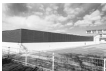
道路側からもしっかりと目隠し