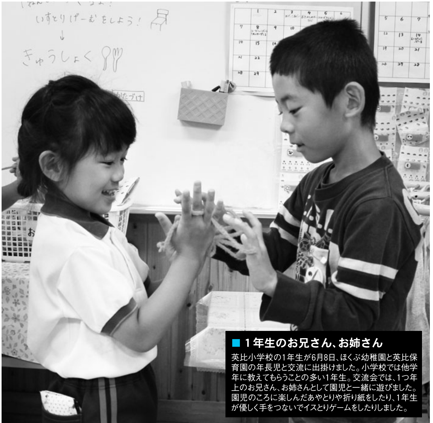
■ 1年生のお兄さん、お姉さん 英比小学校の1年生が6月8日、ほくぶ幼稚園と英比保育園の年長児と交流に出掛けました。小学校では他学年に教えてもらうことの多い1年生。交流会では、1つ年上のお兄さん、お姉さんとして園児と一緒に遊びました。園児のころに楽しんだあやとりや折り紙をしたり、1年生が優しく手をつないでイスとりゲームをしたりしました。