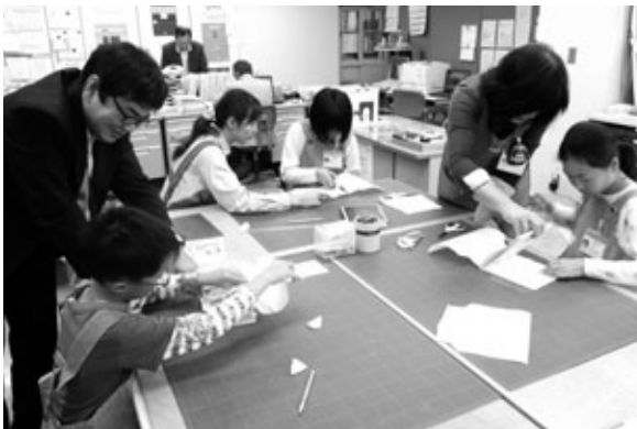
図書館司書体験の様子

町立図書館では、小学生を対象に、司書の仕事を体験してもらい、本に親しみ、図書館への関心を深めてもらう目的で、「あなたも図書館司書」などの行事を開催しています。