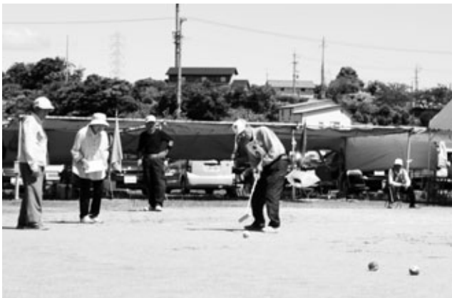
〈元気に試合に臨む選手たち〉

町いきいきクラブ連合会の春季ゲートボール大会が6月6日、町ゲートボール場でありました。選手たちは日ごろの練習の成果を発揮して、予選リーグと決勝トーナメントで熱い戦いを繰り広げました。大会の結果は次のとおりです。▽優勝 団地達者会1、▽準優勝 大古根1、▽第3位 大古根2、草木1