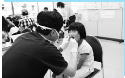
フッ素を塗ってもらっている子ども

県農村生活アドバイザーによる実演講習会も行われ、「減塩梅干し」の作り方の紹介や梅を使った食べ物の試食が行われました。梅雨の晴れ間となったこの日訪れた約1,000人の来場者は、おいしい食べ物やもぎとり体験などで梅を満喫したり、公園で遊んだり、1日を楽しんでいました。