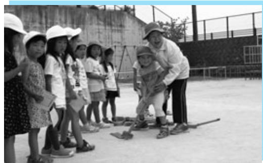
おばあちゃんのおかげで上手に打てたよ

青色回転灯装備車での地道な防犯パトロール活動が評価され、6月3日に半田防犯協会連合会から宮津団地地区と草木地区の前防犯パトロール隊代表者に感謝状が贈られました。併せて宮津地区の防犯パトロール隊には、愛知県警察本部長などの連名感謝状が贈られました。地域の皆さんの地道な活動が安全で安心なまちづくりに貢献しています。