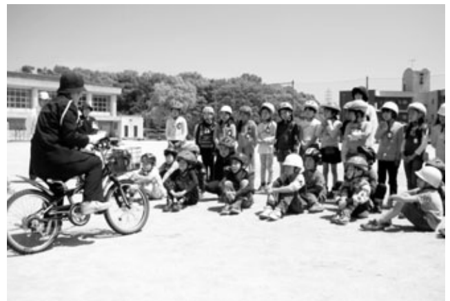
小学校交通安全教室（草木小3年生）