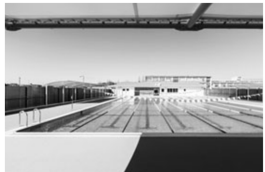
お披露目された新プール

新プールは水面積400平方メートルで水深が1.1メートル～1.3メートル。25メートルコースを8つ取ることができます。付属棟には、更衣室や多目的トイレのほか、災害時にはプールの水を飲料水に変える浄水設備も設置し、災害時にも備えた造りとなっています。