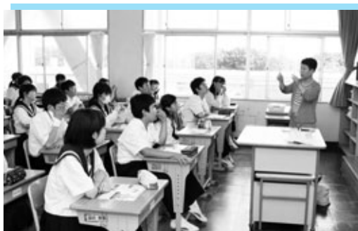
講師の話に耳を傾ける生徒たち

室町時代に伯耆の国（鳥取県）から阿久比町に伝わったとされる花かつみが、鳥取県の倉吉市に里帰りして5周年を迎えました。その記念に町長が、東海鳥取県人会創立50周年記念総会に招かれました。総会では、石田倉吉市長、平井鳥取県知事などと花かつみを話題に親交を深めました。里帰りした花かつみは倉吉市の山名寺の境内に植えられ、毎年美しい花を咲かせています。