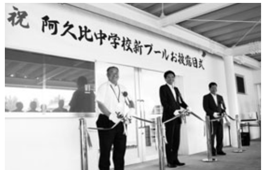
お祝いのテープカット