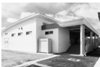
浄水設備も備える付属棟