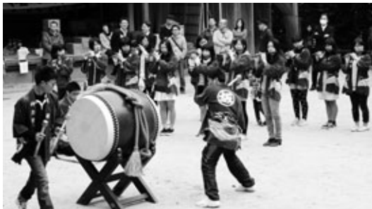
坂部地区のお囃子(はやし)