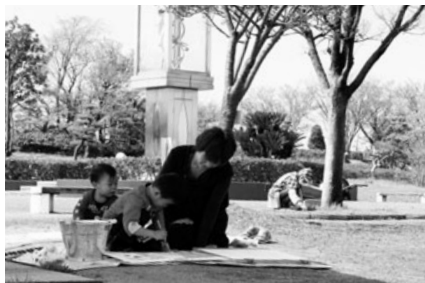
〈ほのぼのとした雰囲気でする写生を楽しむ親子〉

ふれあいの森で4月11日、愛知県労働者福祉協議会知多支部主催の写生大会が行われ、約120人が参加しました。毎年の恒例行事とあって、親子で参加の方が目立ちました。参加した親子らは温かい春の陽気の中、クレヨンや絵の具を使って、画用紙いっぱいに「ふれあいの森」の春の風景を描いていました。