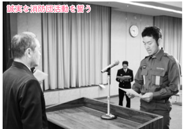
誠実な消防団活動を誓う

平成27年度阿久比町消防団入退団式が4月5日(日)に、勤労福祉センター(エスペランス丸山)で行われました。