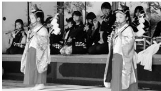
植地区の巫女(みこ)舞