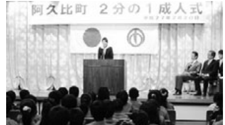
【町全体で絆を深める4校合同の式典】

成人への道のりの半分に達した10歳で、これまでの自分を振り返り、今後の自分の生き方について考える機会として行われる「2分の1成人式」。本町では、毎年町内4小学校合同の式典とともに、各小学校でも「2分の1成人式」を行っています。それぞれの学校での活動を紹介します。