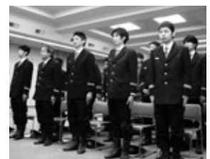
表情が引き締まる分団長