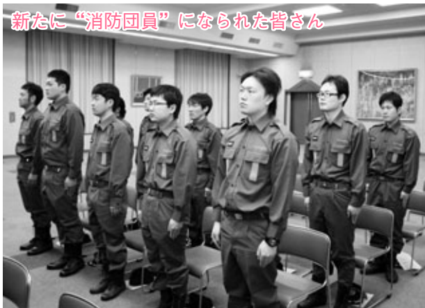
新たに“消防団員”になられた皆さん