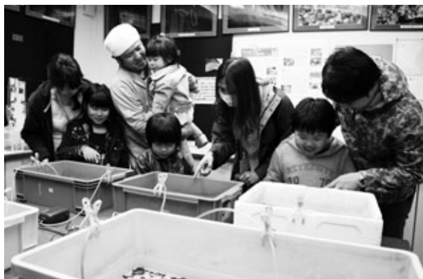
〈幼虫が光る様子を観察する親子〉

「ほたるの幼虫観察会」を4月16日と17日、ふれあいの森ホタル養殖場観察室で行いました。2日間で約100人の親子連れなどが訪れました。