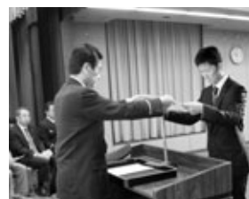
退団者の皆さんお疲れ様