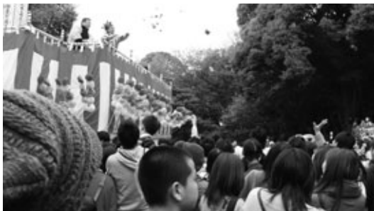
にぎわいをみせる草木地区のもち投げ