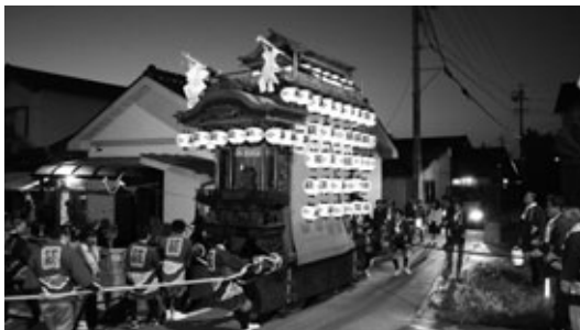
引き回される町指定文化財の「萩大山車(はぎおおやまぐるま)」