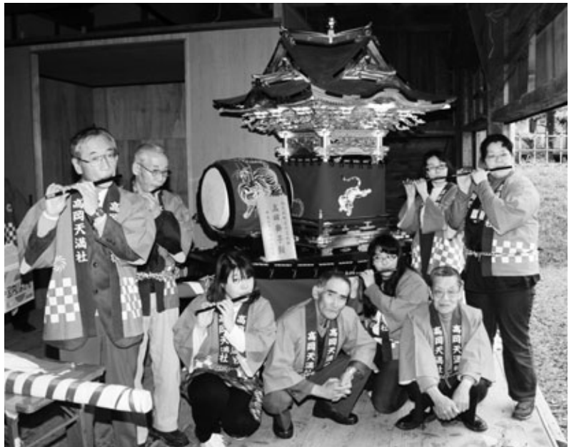
町指定文化財の「高岡獅子館」の周りで笛を披露