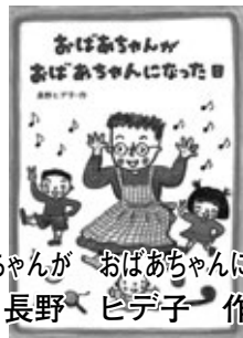
『おばあちゃんが おばあちゃんになった日』 長野 ヒデ子 作