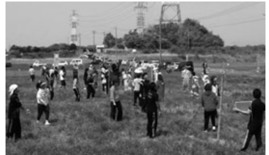
楽しいれんげソフトバレー