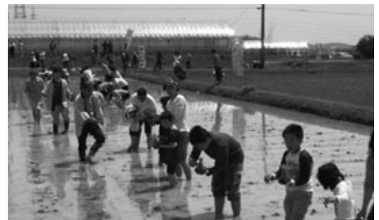
気持ちいい田植え体験