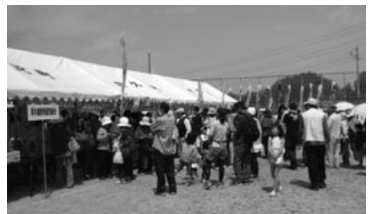
大人気の販売・飲食ブース