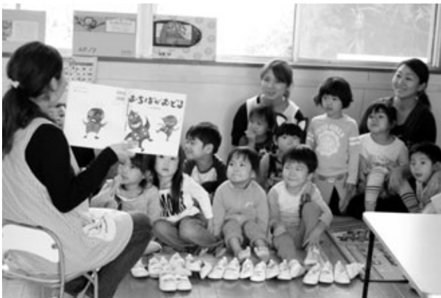
〈絵本の読み聞かせ：言葉〉