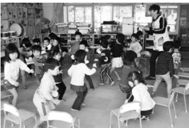
〈集団あそび：決まり〉