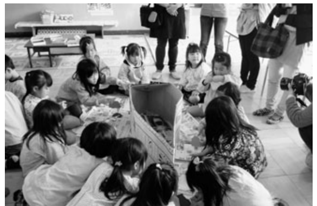
〈形を切って貼り合わせ：形〉