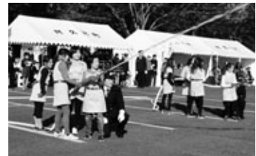
消防クラブによる消火訓練