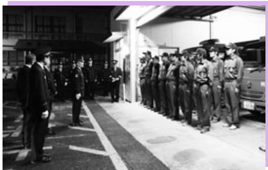
激励を受ける消防団員

税金の大切さを伝える半田税務署主催の“租税教室”が1月14日、南部小学校の6年生を対象に行われました。税務署の職員の話やDVDで税の種類や使われ方などを知り、助け合って暮らすためには税金が必要だと学びました。児童たちは意見を発表したり、税務署職員に質問をしたりして意欲的に授業に臨みました。授業後、児童は「税金がないと世の中がめちゃくちゃになることが分かった。大人になったら、ちゃんと税金を納めたい」と話しました。