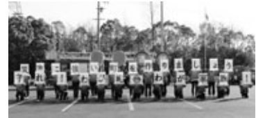
町赤十字奉仕団救命訓練 園児による防火パレード