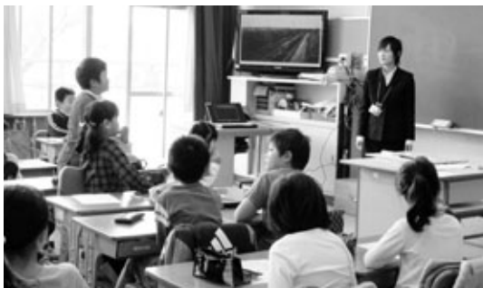
〈「道徳の時間」 生命尊重の心を育む〉

本年度は、10月27日～11月8日を「あぐい教育週間」として、町内全ての園・学校が公開保育・授業を行いました。実践の一部を紹介します。