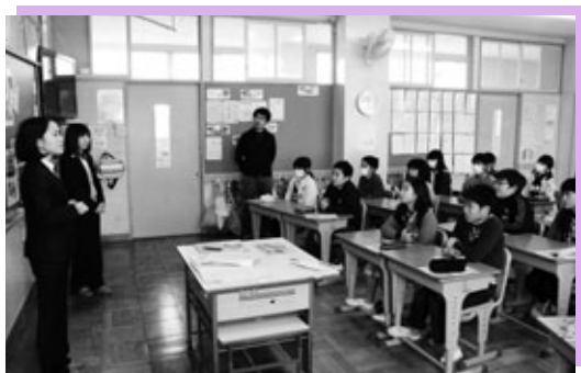
税務署職員から税金について学ぶ児童たち

保育園児といきいきクラブ会員との交流会が13日、城山保育園でありました。坂部地区いきいきクラブ会員14人と園児28人が、コマ回し、たこ揚げ、羽根突き、福笑いといったお正月遊びを通して交流を深めました。未満児は、おばあちゃんたちと福笑いを楽しみました。目隠しをしたおばあちゃんにせつせと目や鼻の厚紙を渡す園児たち。キャラクターの顔が出来上がる歓声をあげていました。