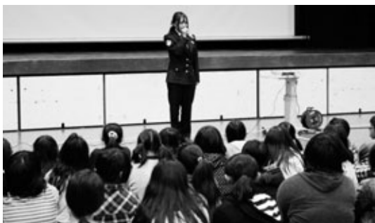
〈「特別活動」 外部講師による『ケータイ安全教室』 保護者や地域の方も参加〉