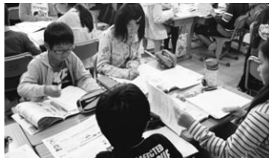
〈「社会科」 資料活用の力を高める〉