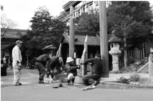
〈門松を組み立てる地区の皆さん〉

宮津にある熱田社で12月28日、大字宮津地区の住民約30人が新年を迎える準備のため、しめ縄の交換や門松作りなどを行いました。午前10時から鳥居や境内にあるクスノキのしめ縄の交換や門松の組み立てが行われ、住民は慣れた手つきで作業を進めていきました。門松は、熱田社や宮津公民館などに計9対作りしました。毎年恒例の門松作りで使用する竹・松・梅・南天・ハボタン・クマザサなどは地区内で取れた材料を使用しています。