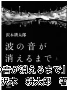
『波の音が消えるまで』 上下 沢木 耕太郎 著

老人が遺（のこ）した一冊のノート。たった一行だけ書かれた、『波の音が消えるまで』という言葉。香港返還前日、あのマカオの地で、一人の男の運命が動き出す。著者初の長編娯楽小説。