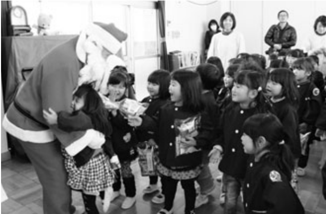
〈サンタクロースを見送る園児たち〉

サンタクロース、ライオンズクラブの会員、ボランティアの阿久比高校生を迎えたクリスマス会が12月17日、南部保育園で行われました。始めに「ジングルベル」を歌ってお迎えし、みんなで「山の音楽家」を振りまねて歌うなどして楽しみました。高校生は楽しい人形劇を、サンタクロースはおかしを園児にプレゼント。最後に帰る時間になったサンタクロースたちに感謝の気持ちを込めて「あわてんぼうのサンタクロース」を元気に歌って見送りました。「人形劇が楽しかった」と話す園児たちは終始笑顔でいっぱいでした。