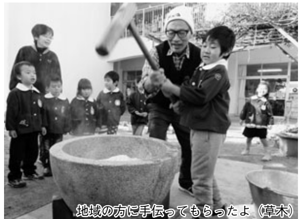
地域の方に手伝ってもらったよ（草木）

草木保育園では高砂会の方の協力を得て、年長児約30人が体験しました。早く餅をつきたくてソワソワしながら順番を待つ園児たち。自分の番になると友達の声援を受け、おじいちゃんたちと一緒に元気に餅をつきました。「柔らかくておいしい」と話す園児たちは、おばあちゃんたちが食べやすく丸めたお餅にあんこなどを付け、おなかいっぱい食べました。