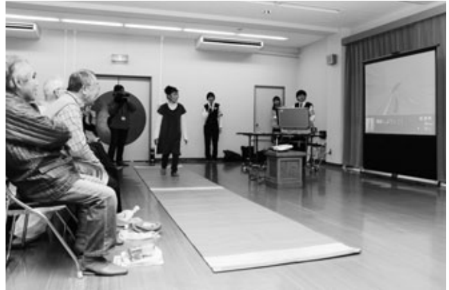
〈歩行シミュレーターを体験する参加者〉

高齢者の交通事故防止を目的とした「高齢者交通安全教室」が12月12日、坂部公民館で行われました。始めに半田警察署員から「高齢者の道路横断中の事故が多いので横断歩道を渡ってほしい」とお願いがありました。次に、半田警察署、愛知県警交通安全啓発チーム“あゆみ”、交通安全協会の協力で、3次元CGで道路横断の模擬体験ができる“歩行者シミュレーター”を使い、安全な道路の渡り方と正しい交通マナーを実践的に学びました。歩行者シミュレーターを体験した男性は、「年をとって見落としが増えてきたので、横断する際はしっかり注意していきたい」と話しました。