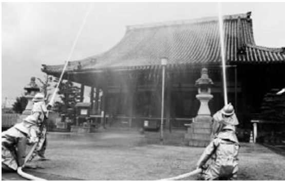
蓮慶寺(植大)で行われた 昨年の文化財防火訓練

今年の訓練は1月25日(日)に、町文化財の仁王門と仁王像がある正盛院(草木)で実施します。半田消防署阿久比支署と阿久比町消防団が、午前9時30分から午前10時まで消火放水訓練を実施します。訓練は小雨決行で、訓練中は一般車両の通行規制など、近隣住民の皆さんのご協力をよろしくお願いします。