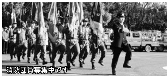
消防団員募集中です