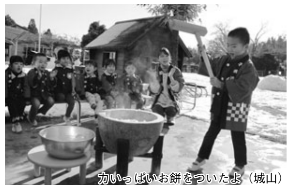
力いっぱいお餅をついたよ（城山）

あなたは写っていませんか。もし写ってれば、写真をおわけしますので連絡ください。 政策協働課 ☎(48)1111(内303)