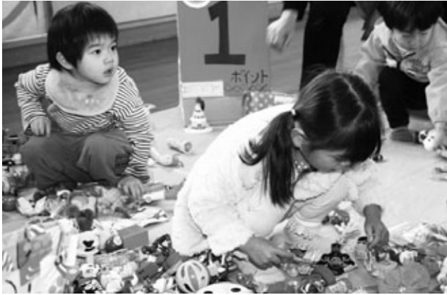
〈大人気の“かえっこバザール”〉

勤労福祉センター（エスペランス丸山）で12月6日、子育て支援グループむぎ・むぎ主催の子育て世代を中心とした交流会“わくわくAgufesta 2014”が開催されました。