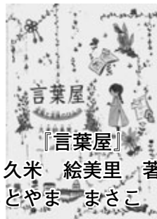
『言葉屋』 久米 絵美里 著 もとやま まさこ 絵

小学5年生の詠子のおばあちゃんのお仕事は、町の小さな雑貨屋さん。と思いきや、本業は、「言葉を口にする勇気」と「言葉を口にしない勇気」を提供するお店、言葉屋だった。「私、言葉屋になる!」