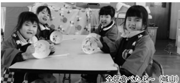
全部食べたよ～（城山）