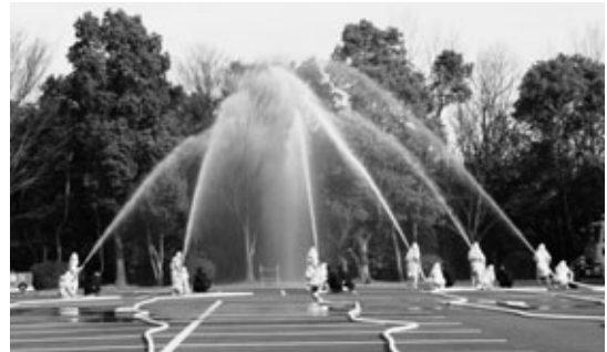
1月 出初式（消防関係者による仕事始めの行事）