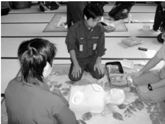
8月 普通救命講習（心肺蘇生法などを学ぶ講習）