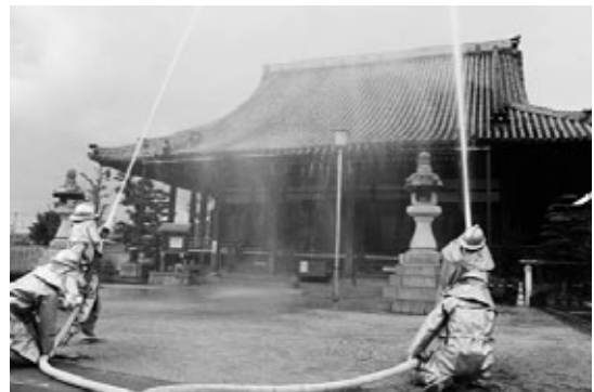
1月 文化財防火訓練（町文化財の延焼阻止の訓練）