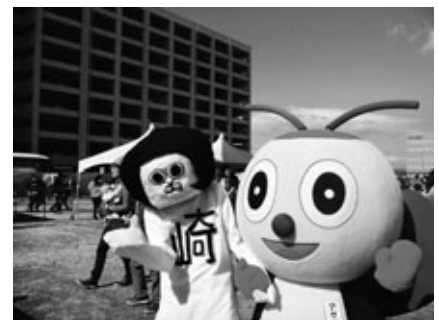
たくさんの友だち（ゆるキャラ）と交流

ゆるキャラ人気ナンバーワンを決める「ゆるキャラグランプリ2014in あいちセントレア」が11月1日～3日、中部国際空港セントレア特設会場で行われました。阿久比町マスコットキャラクター「アグピー」は、総合部門1,699体中604位でした。温かい応援ありがとうございました。今後も応援よろしく願います。