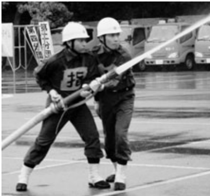
6月 操法大会（消防器具操作と動作を競う大会）

日ごろから訓練を重ね、火災発生時の消火活動、大規模災害時の救出・救助活動、警戒巡視、避難誘導などに活躍します。さらに消防出初式、観閲式、消防操法大会、年末夜警など年間を通じて活動しています。1年を通して地元で活躍する消防団員たちは強い絆で結ばれています。