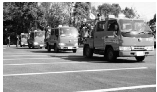
3月 観閲式（消防団による式典と総合訓練）