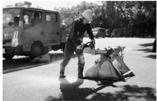
10月 実戦訓練（災害現場を想定した訓練）