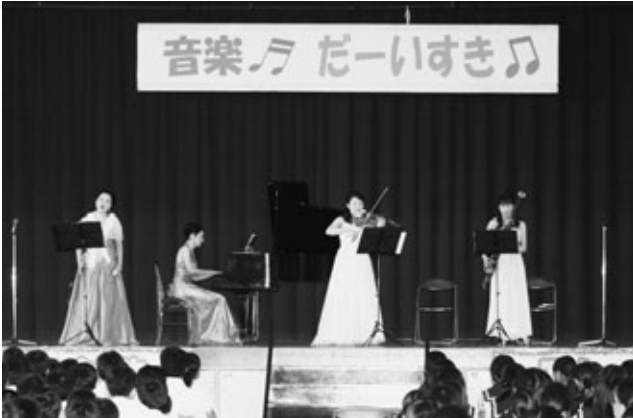
〈プロの音楽家が生の演奏を披露〉

「好き好きミュージック」が主催するわくわくコラボ事業「音楽だ〜いすき」が9月25日、阿久比中学校で行われました。桜輝祭文化の部の一部として行われ、楽器紹介、曲当てクイズやクラシックの名曲などプロの奏でる音やリズムを楽しみました。最後に約千人の参加者で“Let it go! ~ありのままで~”とアンコールで阿久比中学校愛唱歌の“君がいるから”を大合唱し、興奮は最高潮に達しました。「音楽はすてきだなと改めて感じました」と生徒が話すのとおり、生の演奏を聞き、音楽のすばらしさを感じた2時間となりました。