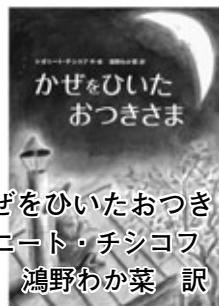
『かぜをひいたおつきさま』 レオニード・チシコフ 作・絵 鴻野わか菜 訳

おつきさまが、空からおりて草の上でやすんでいると・・・青年とおつきさまとのあいだにめばえた友情を、やさしくあたたかく描くお話。