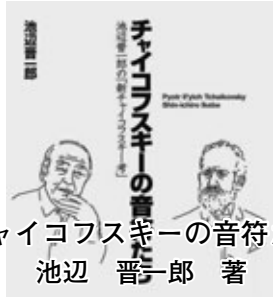
『チャイコフスキーの音符たち』 池辺 晋一郎 著