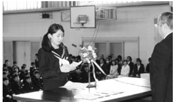
中学校入学式(4月4日)