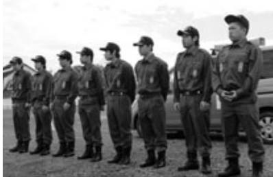
新入消防団員の皆さん