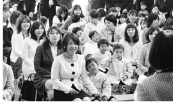
ほくぶ幼稚園入園式(4月8日)