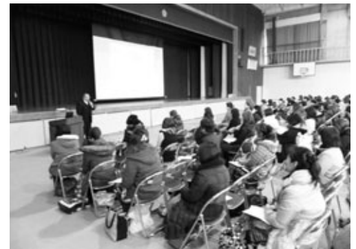
幼保小中一貫教育プロジェクトの説明

中学校では、一貫教育について説明する場として、毎年1月に行われる入学説明会を利用しています。説明会に参加している小学校6年生の保護者に、一貫教育がねらいとしている15歳の「めざす子どもの姿」を中心に、中学校の取組について話します。また、小学校生活と中学校生活の違いや保護者の役割についても話します。特に、最近問題となっているスマートフォンの利用については、ソーシャルネットワークサービスによる事例を挙げ、家庭での注意を呼びかけています。