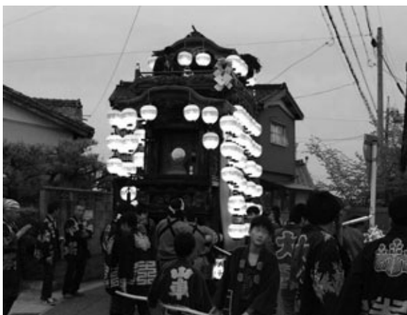
はちまんしゃだし ちょうちんの明かりが浮かび上がる八幡社山車