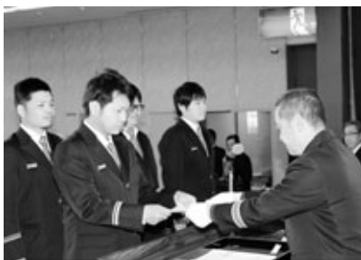
委嘱状を受ける分団長