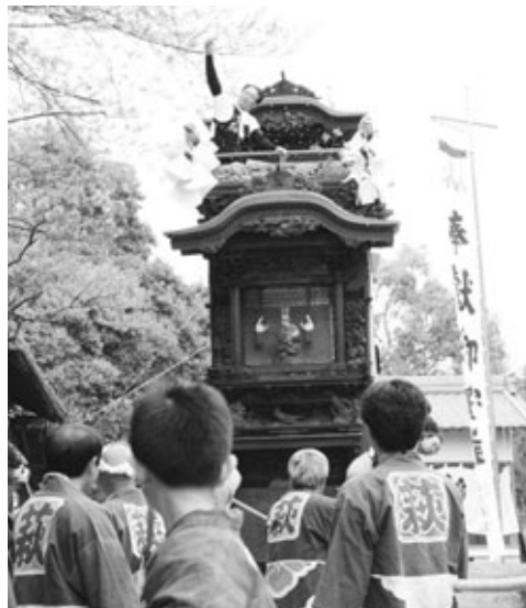
萩おおやまくるま 萩大山車の“坂おろし”

各地区の神社などで春祭りが行われました。山車を引き回す威勢のよい声が響き渡り、祭り囃子 ばやし の心地よい音色が祭りに華を添えました。