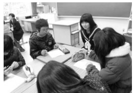
中学校の先輩の話 なま を聞く会