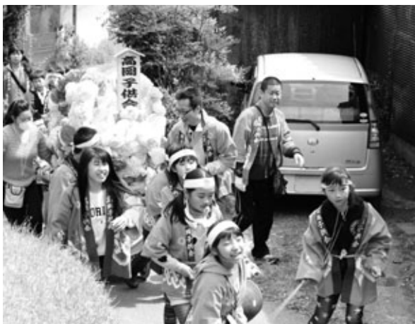
子どもみこしで練り歩く高岡地区の子どもたち