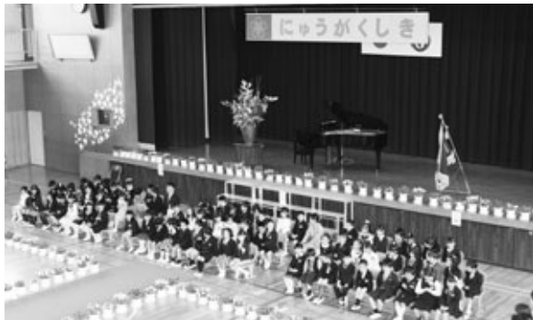
南部小学校入学式(4月7日)