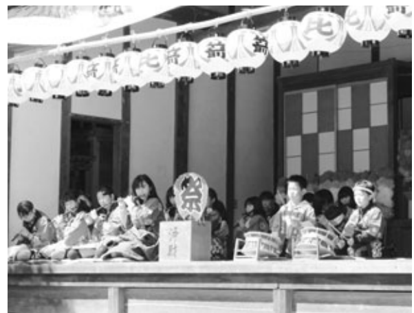
ばやし 矢口地区の祭り囃子

あなたは写っていませんか。もし写ってれば、写真をおわけしますので連絡ください。 政策協働課 ☎(48)1111(内303)