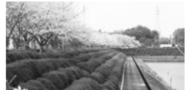
4月初旬は、桜が満開でした。

遊歩道から臨む美しい景色はもちろん素敵ですが、私のオススメは、南に延びる350mのバックストレート。週末に、家族を連れて花かつみ園へ。娘とのかけっこ対決では、圧勝。「お父さん、走るの速い!」とほめられ、一日いい気分が経過することができました。緑あふれ、水の音に心癒やされる花かつみ園遊歩道に、一度足を運んでください。