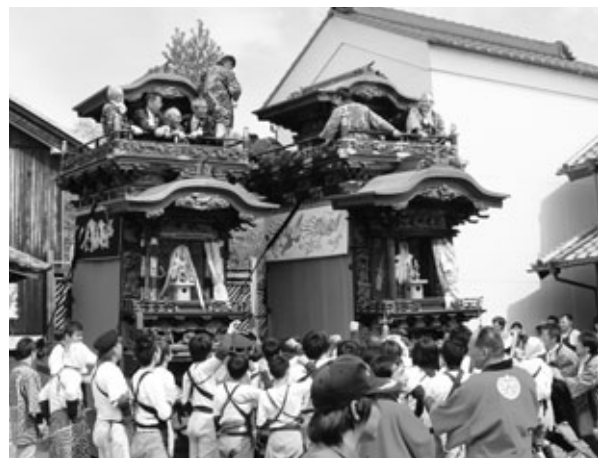
みやづきたぐみだし 宮津北組山車(右) 南社山車(左)