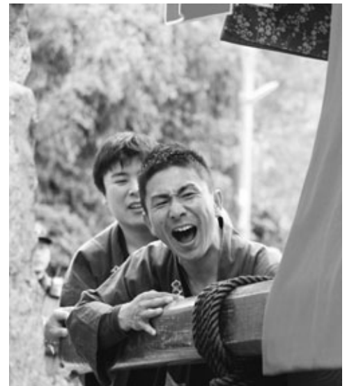
力強くかじを取る若衆