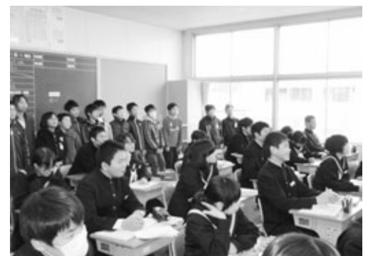
中学校の授業を見学

今後も、全ての子ども達が「通いたい」と思う阿久比中学校にできるよう、一貫教育の取組を充実していきたいと思っています。