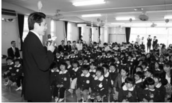
草木保育園入園式(4月3日)