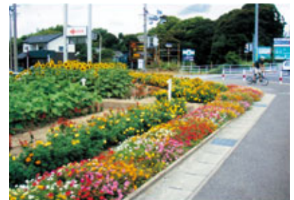
【入賞】板山ガーデンクラブ