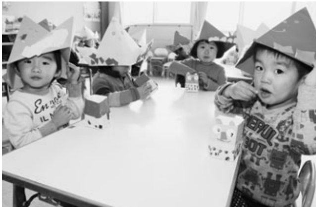
お面をかぶって豆を食べる園児たち