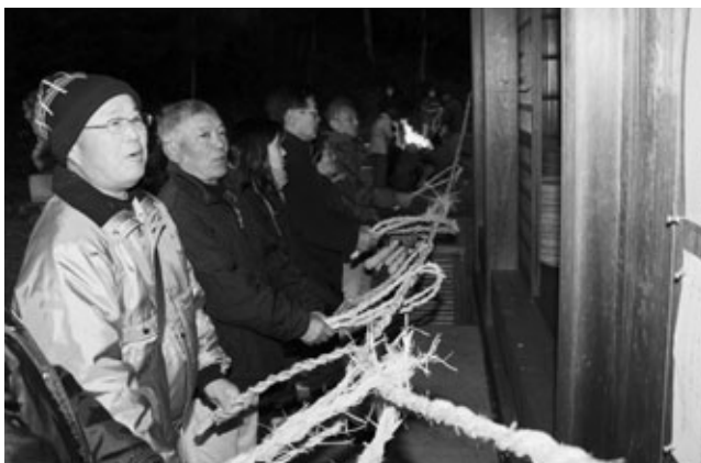
唱えごとをする地区の皆さん

旧暦1月7日に毎年開かれる地区の伝統行事「山の神祭」が2月6日の早朝、白沢八幡社で行われました。氷点下に冷え込んだ厳しい寒さの中、集まった人たちは1年の豊作や健康を祈りました。