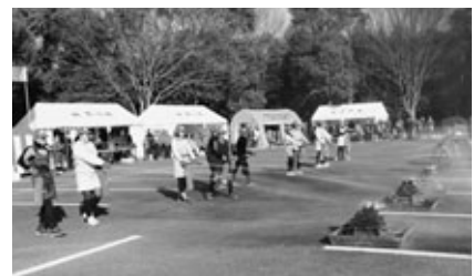
少年消防クラブの消火訓練