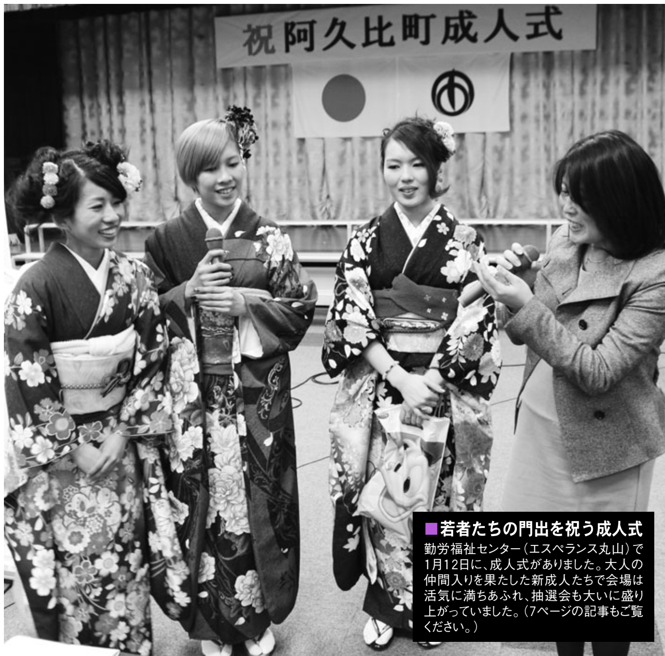
■ 若者たちの門出を祝う成人式 勤労福祉センター(エスペランス丸山)で1月12日に、成人式がありました。大人の仲間入りを果たした新成人たちで会場は活気に満ちあふれ、抽選会も大いに盛り上がっていました。(7ページの記事をご覧ください。)