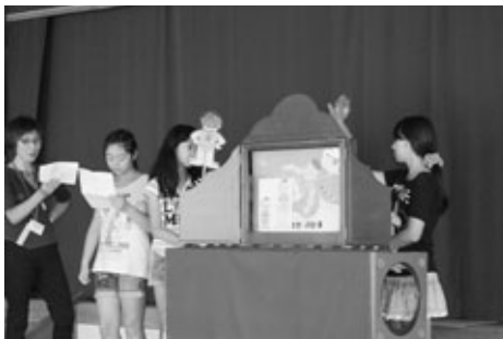
保健委員による保育園での睡眠指導