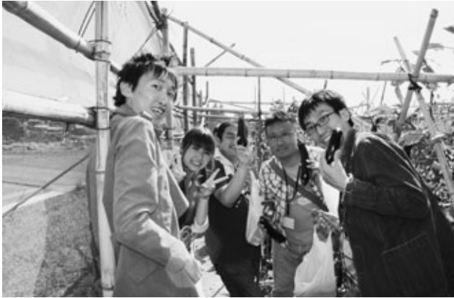
収穫したナスを手にする参加者たち

町の史跡散策や農業体験をする「阿久比町観光体験学習会 with アグガール」が9月28日に開催されました。絶好の晴天に恵まれ、参加者は観光PR隊のアグガールと一緒に、昼食を食べたり、ナスの収穫をしたりして充実の一日を過ごしました。