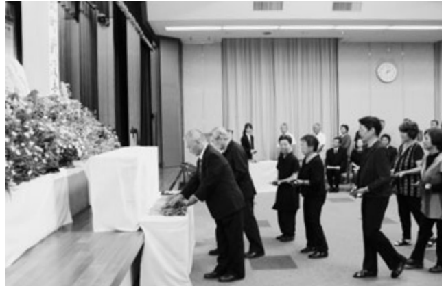
菊の花を供える参列者

平成25年度阿久比町戦没者追悼式を10月2日に勤労福祉センター（エスペランス丸山）で開きました。遺族など約90人が出席し、太平洋戦争で亡くなった236人の戦没者を追悼しました。