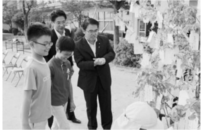
町長や子どもと一緒にツリーを見る大村県知事(右奥)

英比小学校の6年生児童と英比保育園の年長児たちが10月7日、願いごとなどが書かれた短冊を結んで飾る「ウィッシュ・ツリー」に、自分たちの願いを書いた短冊を町長や大村愛知県知事と一緒に結びました。思いの込められた短冊が数多く結ばれた「ウィッシュ・ツリー」は、オノ・ヨーコさんの呼び掛けによる「あいちトリエンナーレ2013」の参加型作品です。