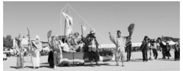
優秀賞 宮津団地地区