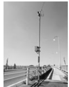
オアシス大橋に設置された防犯カメラ

犯罪を抑止し、安全で安心なまちづくりを推進するため、本年度も昨年度に引き続き、町内の主要交差点や公園などに防犯カメラを設置しました。