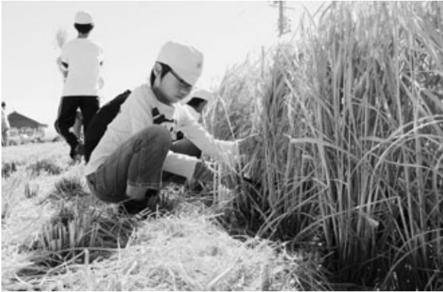
稲刈りをする草木小児童

草木小学校の4年生、5年生の児童62人が9月26日、小学校近くの田んぼで稲刈りをしました。子どもたちは慣れない手つきで鎌を使い、豊かに実った稲を刈り取るとともに、みんなで協力して、刈り取った稲を脱穀する機械へ運びました。