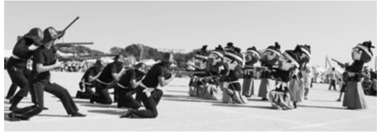
最優秀賞 高根台地区