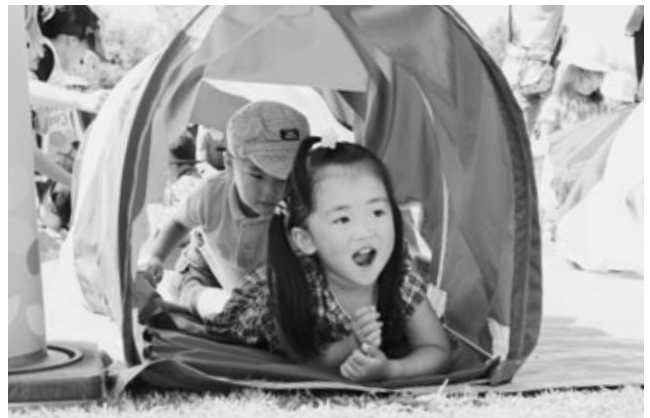
トンネルをくぐる子どもたち

子育て支援センター“あぐびっぴ”の運動会が、10月11日と12日にスポーツ村陸上競技場で行われました。子育て応援サポーターのボランティアや民生児童委員の皆さんにも協力いただいて開かれた運動会は、2日とも晴天に恵まれ、町内だけでなく近隣市町からも訪れた多くの親子連れなどでにぎわいました。