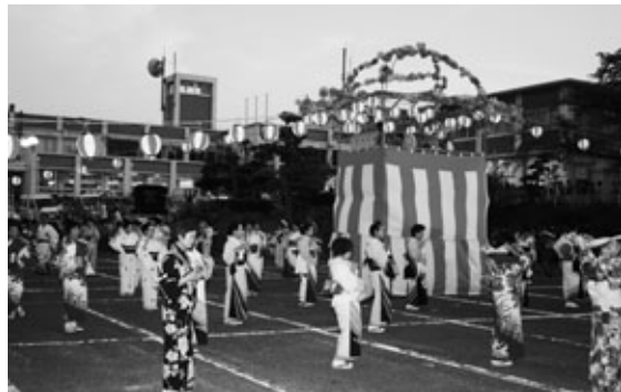
輪になって踊る皆さん

町文化協会主催の「あぐいふれあい盆踊りの夕べ」が8月16日に役場前駐車場で開かれました。中央公民館南館の取り壊し工事などが始まるため、現庁舎前で行うのは今回が最後。浴衣姿の老若男女がやぐらを囲み、阿久比音頭、オアシス音頭などの曲に合わせて、うちわや手拭いを手に踊りました。