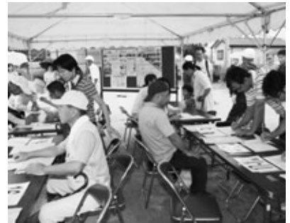
避難者の集計作業

地震はいつ起こるかわかりません。自主防災会の訓練などへ積極的に参加するとともに、耐震改修や家具の転倒防止対策、非常持ち出し袋の準備などを行い、日頃から地震に備えましょう。