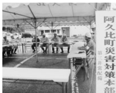
テントに設置された町災害対策本部