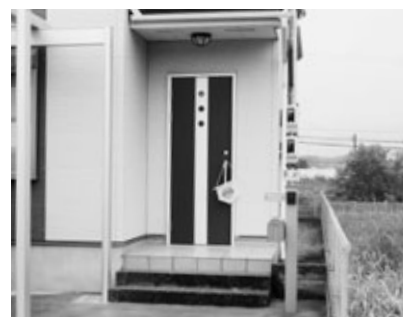
玄関先に掲げられた安否確認フラッグ