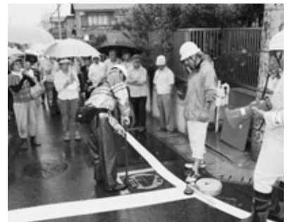
消火栓を使って訓練