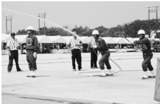
標的に向け放水する選手たち

第58回愛知県消防操法大会が8月10日、西尾市坂田球場で行われ、知多郡5町の代表として阿久比町消防団が小型ポンプ操法の部に出場しました。県内市町村から14チームが出場し、磨き上げられた操法技術を競い合いました。