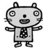
愛知県弁護士会新キャラクター 聞之助(きくのすけ)