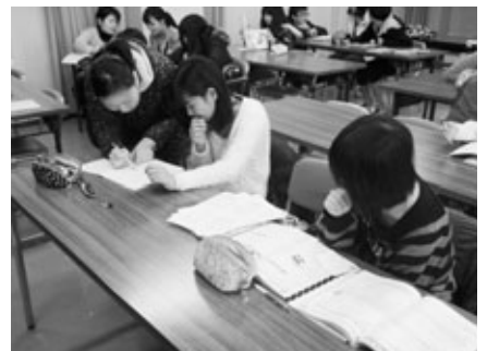
困ったらボランティア講師に

このサタデースクールは、来年度も継続予定。新年度が始まって5月ごろに塾生募集を行う予定です。2月23日と3月2日には、来年度中学校へ進学する小学6年生の体験入校を実施します。たくさんの参加者が集まることを願っています。