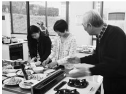
願いを込めて巻き寿司作り

今年度最後となる2月2日の朝食は、節分直前ということで恵方巻きでした。くらしの会の皆さんは、朝も早い6時30分に中央公民館の調理室に集まり、酢飯や具の準備をしました。昨年も同じメニューでしたが、受験を控えた3年生のために今年は、合格祈念の願掛けをした焼きのりが準備されていました。8時過ぎから集まってきた塾生は、自分ですしを巻く体験をしました。