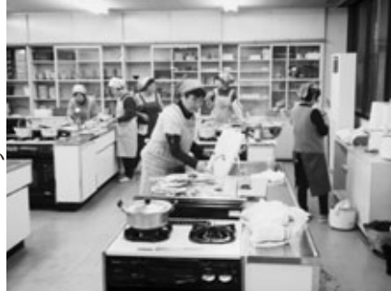
早朝から準備する皆さん

「阿久比サタデースクール」は、スポーツ村クラブハウスで毎週土曜日午前8時30分～午前10時30分の2時間行う「中学生土曜朝塾」で、中学生の生活習慣と学習習慣の定着を図るためのものです。「早寝早起き朝ごはん」全国協議会からの委託事業で、今年で4年目を迎えます。サタデースクールでは、「あぐいくらしの会」にご協力いただき、学期に1度朝ごはんを準備しています。平成24年度は8月4日、10月27日と平成25年2月2日に行いました。