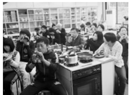
恵方の南南東を向き味わう

自分で作った太巻きを、今年の恵方を向きそれぞれの願いを込めながら塾生たちは味わいました。けれども願いを叶えるには、やはり自分で努力することが重要です。朝食後は、別室で数学と英語の学習にしっかりと取り組みました。くらしの会、ボランティア講師の皆さんは、がんばる阿久比中学生たちの応援団です。