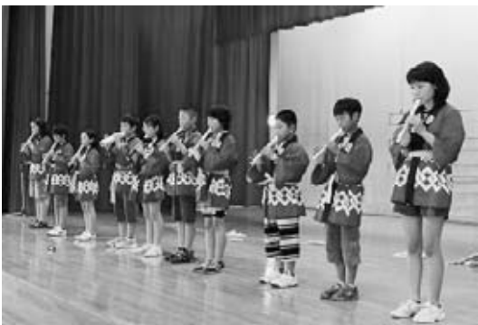
<リコーダーでアニメソングを演奏>

フェンシャン小学校とは平成20年度から派遣を通じた交流が始まり、今年で5年目となります。残念ながら先方の申し出により、昨年度に続き本年度もシンガポールからの受入事業は中止となってしまいました。一方、こちらからの派遣については快く受け入れてくださり、子どもたちは思い出を作ることができました。