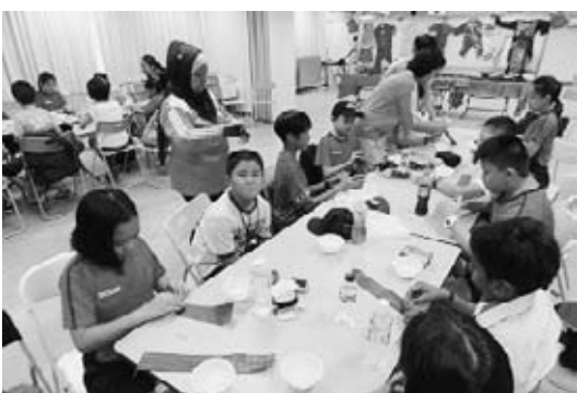
<文化体験(ちまきづくり)>