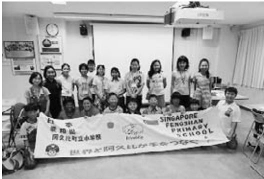
<フェンシャン小学校での歓迎>

7月24日(火)にセントレアを出発した小学生海外派遣団が、7月29日(日)に無事帰国しました。派遣団の6年生10人は、町の代表としてシンガポールのフェンシャン小学校との交流を深め、外国を見聞してきました。