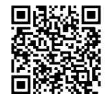
小学生海外派遣 ブログQRコード

今年も海外派遣の様子は、現地からブログ( http://blog.goo.ne.jp/singa12singa ) にアップしました。各小学校・学校教育課のホームページからご覧いただくことができます。携帯電話でご覧になる方は、右のQRコードをご利用ください。