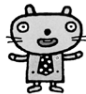
愛知県弁護士会新キャラクター 間之助(きくのすけ)